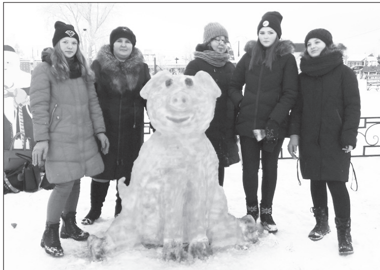
Одна из снежных фигур, выполненных суерскими школьниками.

До наступления Нового года времени остаётся совсем мало, а это значит, что мы активно готовимся к такому чудесному празднику, и наше село не исключение!