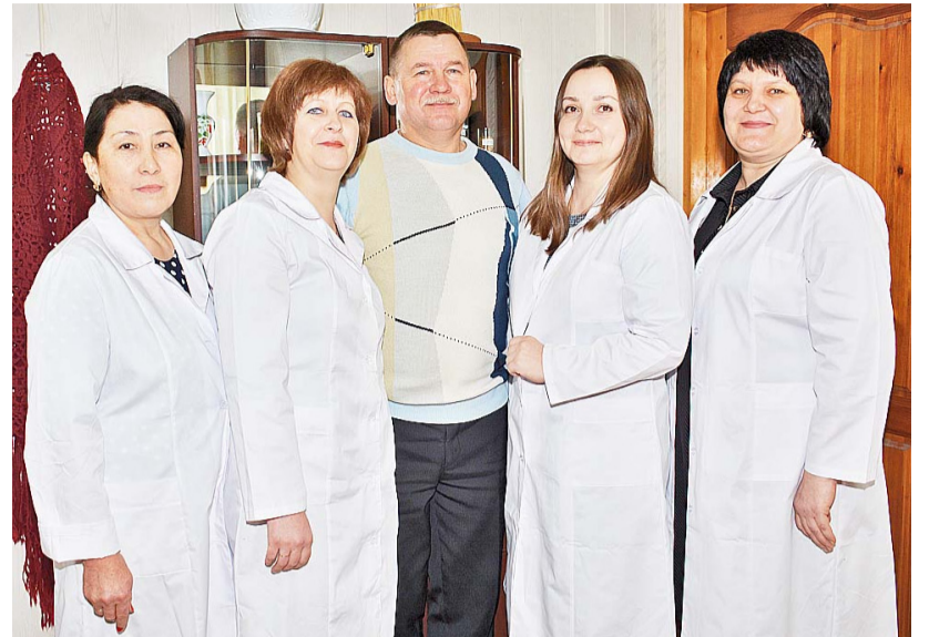
Специалисты Казанского Россельхозцентра одни из первых в области проводят проверку семенного фонда

СХПК имени Чапаева – 100% ООО «Альянс-Агро» – 100% ЗАО АК «Маяк» – 90% СХПК «Колхоз им. Кирова» – 50% ООО «Сельхозинтеграция» – 41% КФХ – 40% АФ «Новоселёвское» – 35% ООО «Покровское» – 20% ООО «Мичуринская свиноводческая компания» – 20%