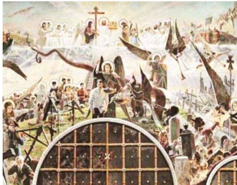
«Страшный суд». Роспись западной стены для кафедрального собора Якутска

яность мысли. Если бы мы могли молиться без рассеяния, мир был бы совсем другой.