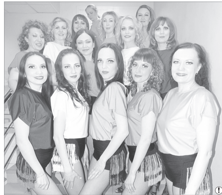
Латина привлекает яркостью, темпераментом, страстью - как и подобает танцу из Латинской Америки - говорят ялуторовчанки