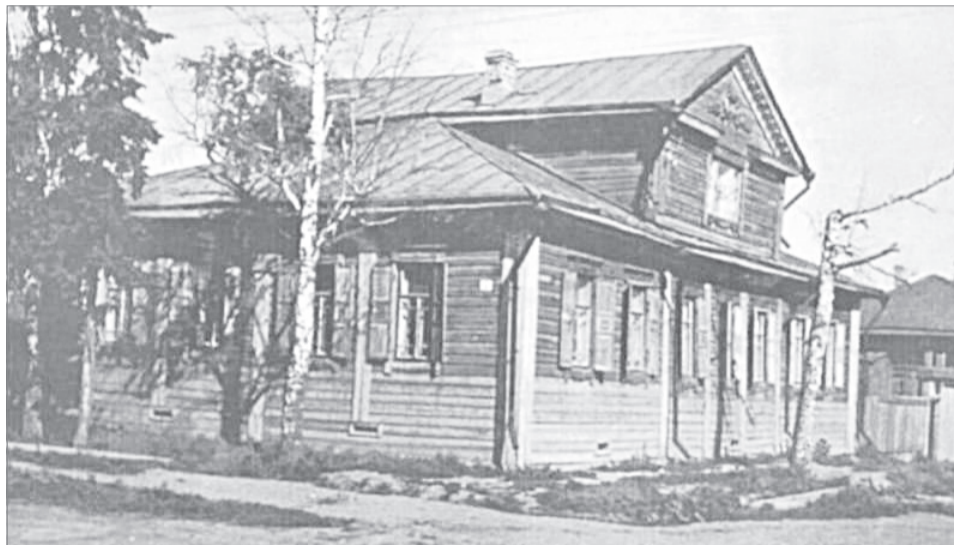
Дом Фонвизиных в Тобольске