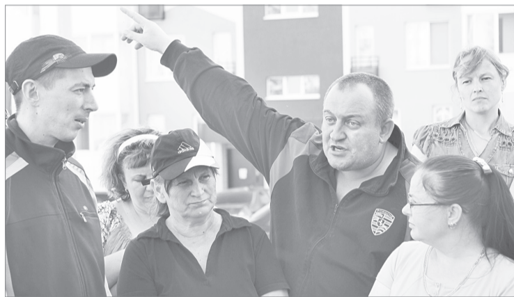
Ещё прошлым летом жильцы домов по ул. Свободы, 164 просили представителей застройщика и УК нарастить ограждение футбольного поля. Вопрос до сих пор не решен