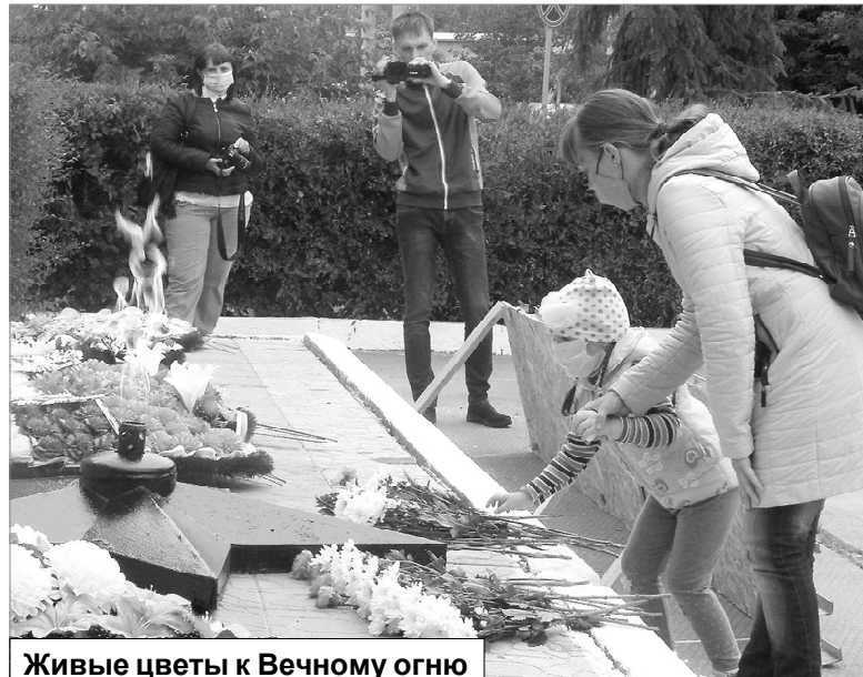
Живые цветы к Вечному огню