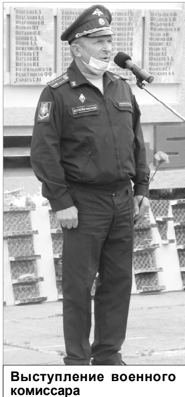
Выступление военного комиссара