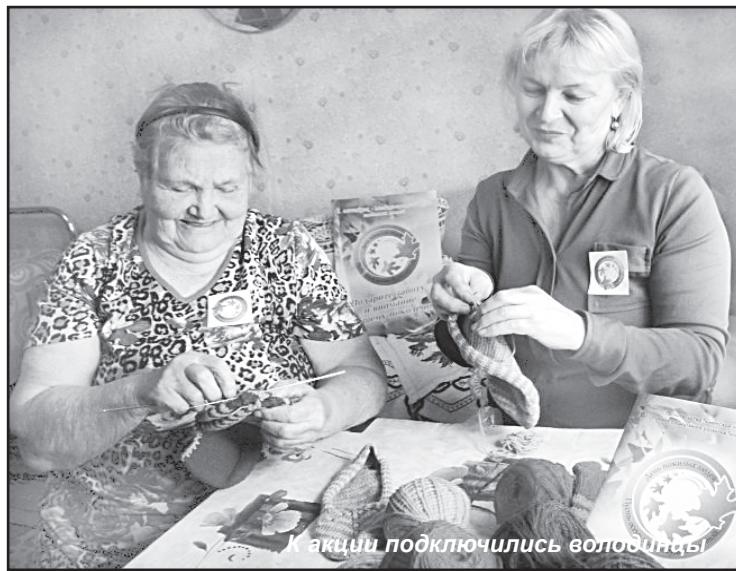
К акции подключились волонтеры

Как мало порой надо человеку для счастья: просто чтобы о нём помнили... или чтобы принимали его помощь. Многие уже догадались, что речь пойдёт о благотворительности, которая дарит радость как тем, кто получает подарок, так и тем, кто его даёт.