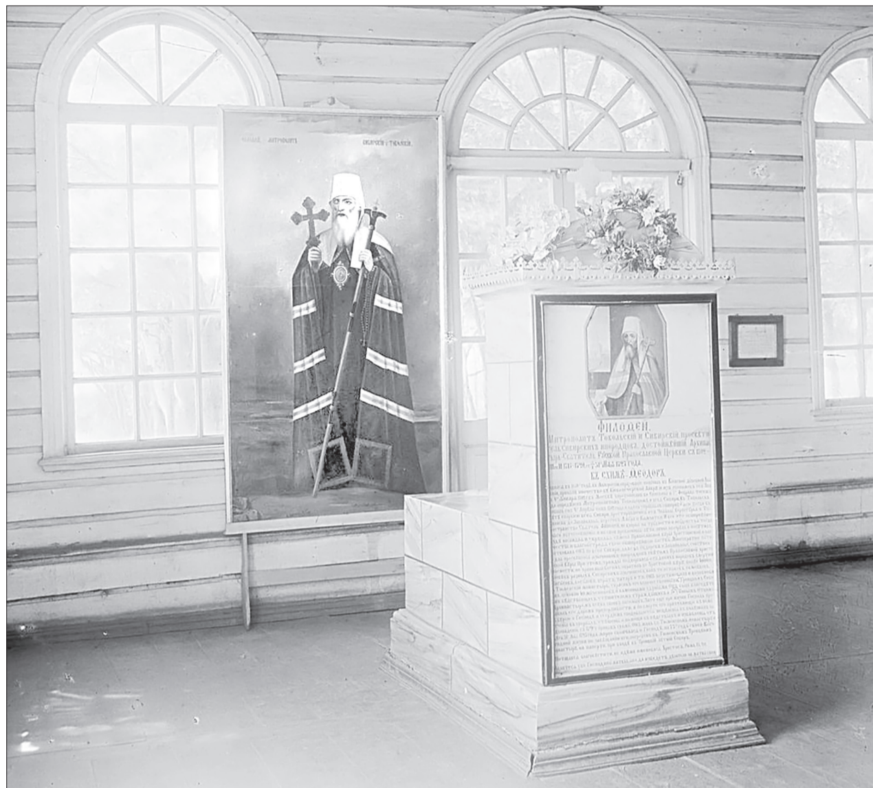
Могила митрополита сибирского Филофея располагается в соборе тюменского Троицкого монастыря