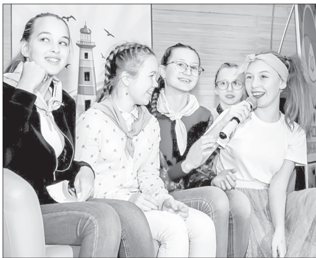
На осенней смене в детском лагере «Алые паруса» ребята изучали азы журналистики

На память о смене нам вручили подарки с сим-