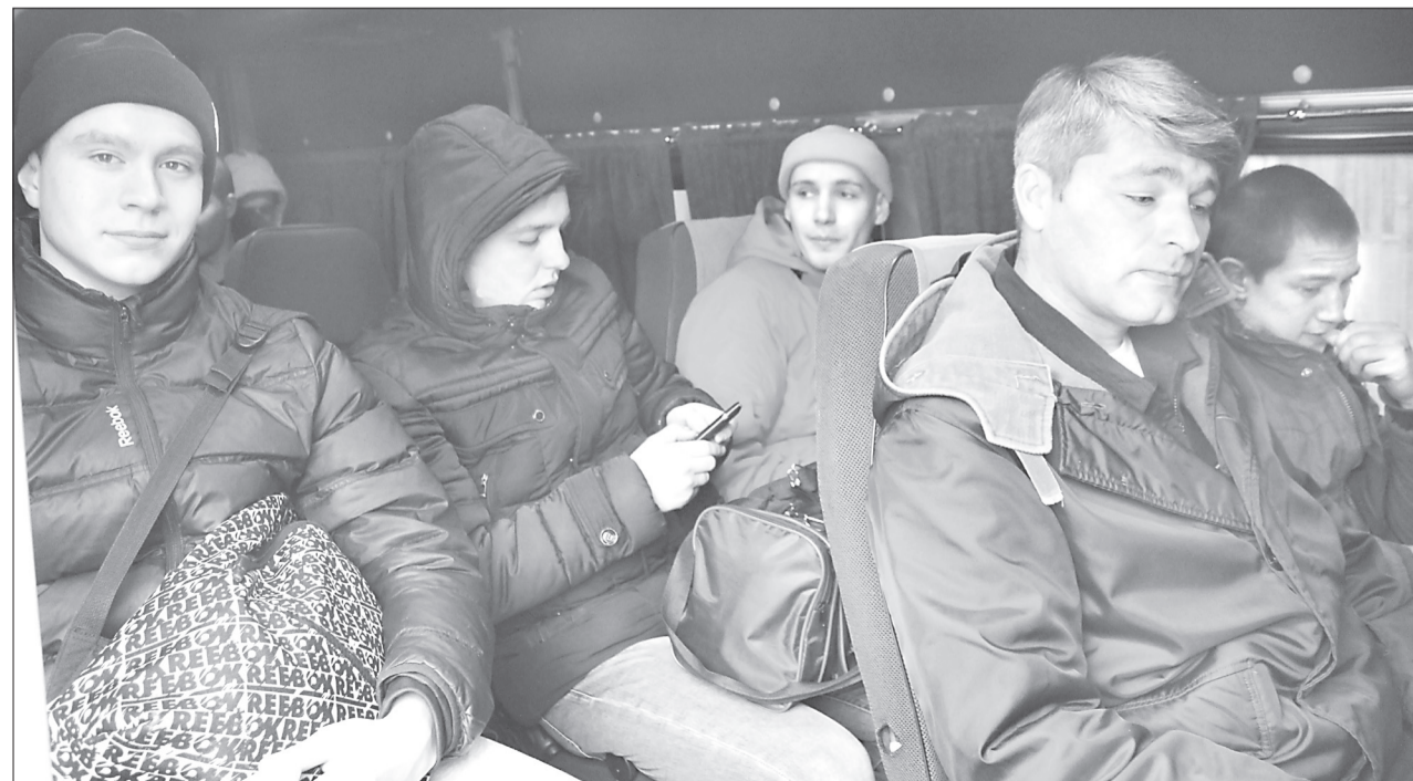
Впереди у ребят - 365 дней службы вдали от дома и родных

В какие войска распределены наших земляков - станет известно позже.