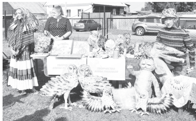
Чернаковские рукодельницы вложили душу в свои творения.

Любое районное мероприятие всегда оставляет массу впечат-