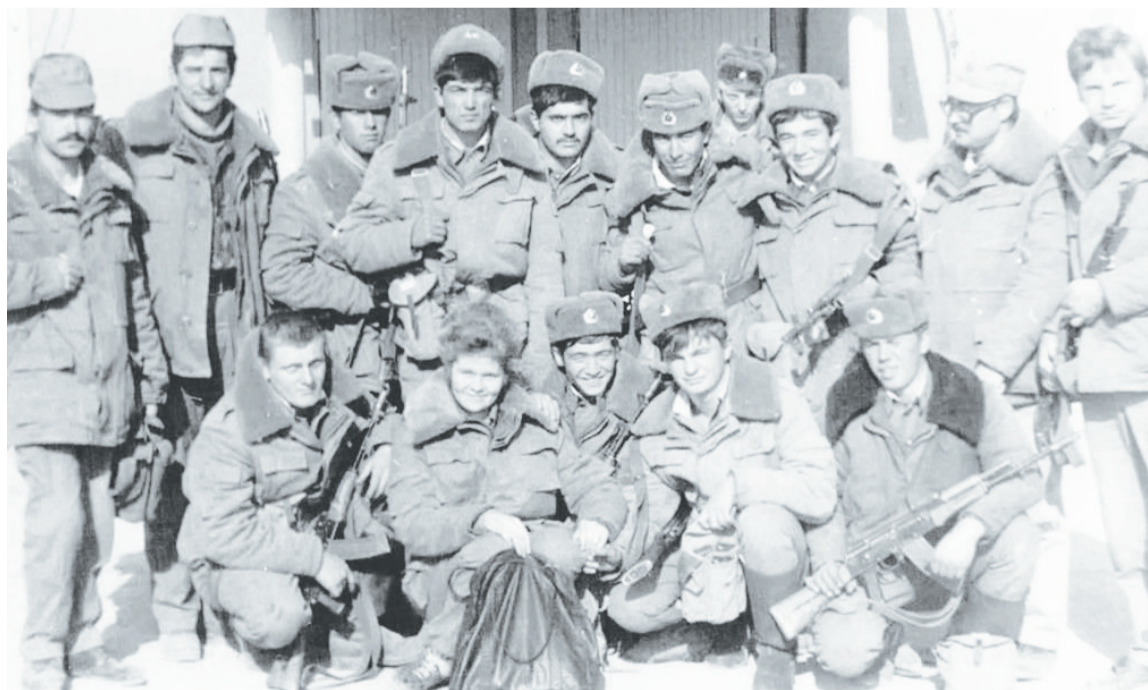
Воины-интернационалисты комендантской бригады в Хинджане (Чаугани).

Подготовила Диана ВОРОНЧАГИНА.