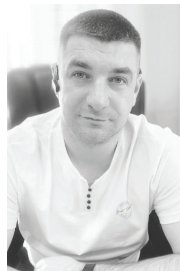
та Упоровской спортшколы в новом формате?

– Как сейчас готовятся спортсмены, и когда начнётся рабо-