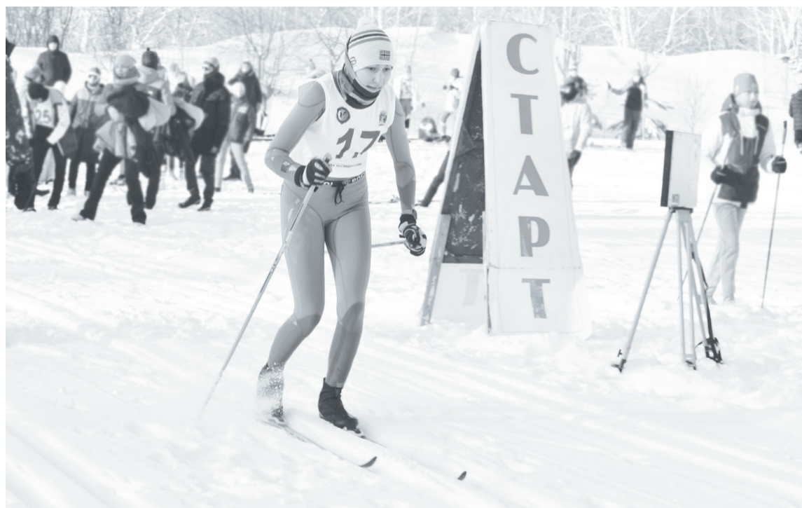
На соревнованиях не ниже областного уровня будут участвовать дети, сдавшие установленные нормативы.

Вера ЛИПУХИНА.