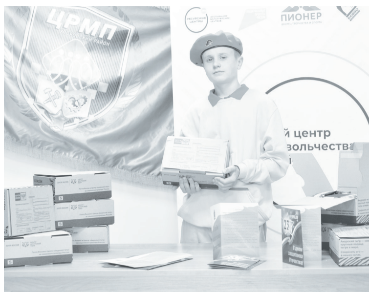
Активное участие в акции принимают юнармейцы района.

Как сообщили в Центре реализации молодёжных программ, подготовка к акции началась ещё до нового года. Заблаговременно был заключён договор с Почтой России, закуплены коробки и получены списки военнослужащих из каждого сельского поселения. Последние посылки с поздравлениями и подарками