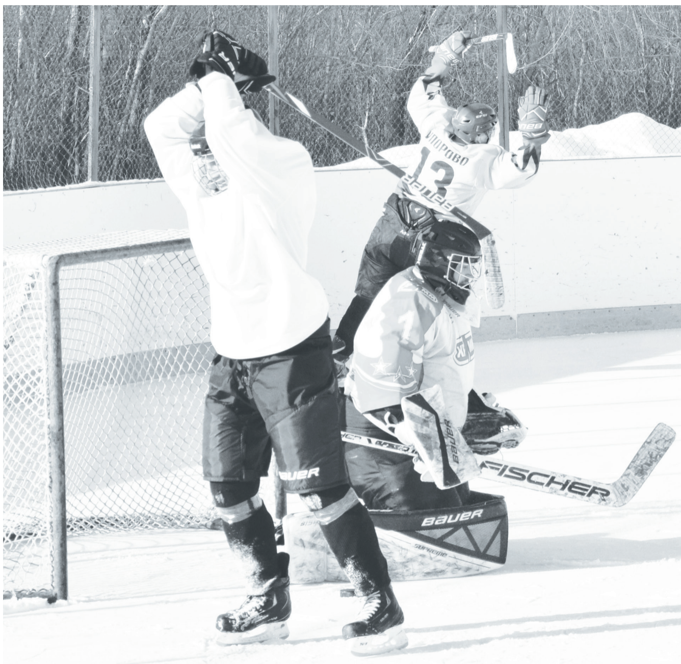
Раздосадованный пропущенным голом скородумский игрок пытается сломать игровой инвентарь.