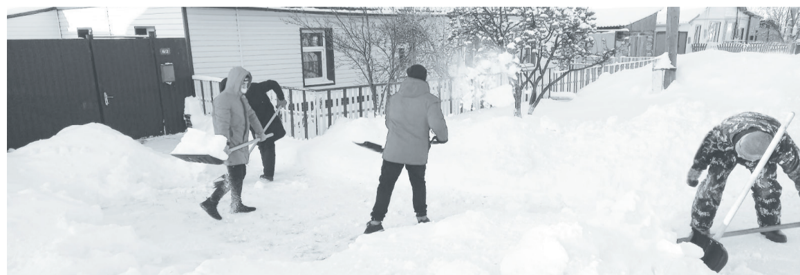
Упоровские старшеклассники оказывают тимуровскую помощь пенсионерам райцентра.