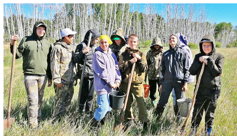
Бригада добровольцев из Казанской школы к посадке саженцев готова

У людей есть потребность делать добро, и эту потребность организаторы мероприятий вполне могут реализовать. Вариантов для этого предостаточно. В планах эковолонтеров Казанской школы – провести акцию «Экосумка»: сшить модные сумки и начать распространять их взамен пластиковых пакетов.