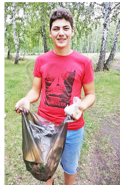
Лес должен быть чистым, а для мусора есть пакеты