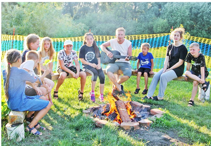
Посиделки у костра с гитарой дарят массу незабываемых впечатлений