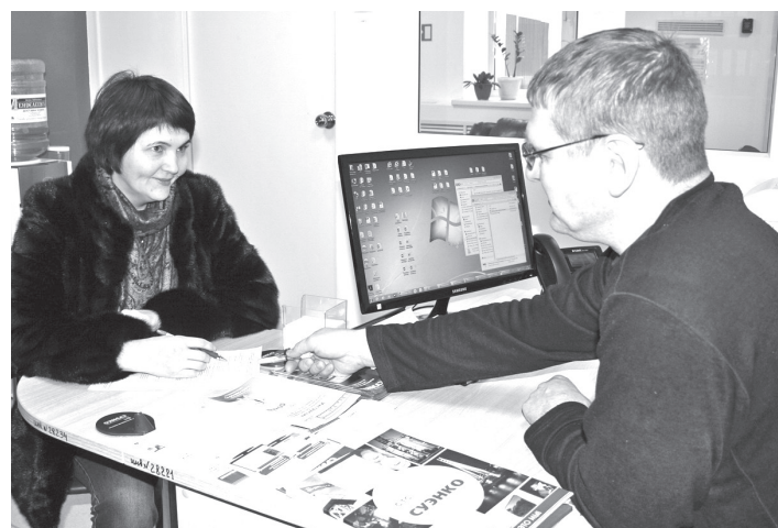
• Центр обслуживания клиентов по адресу: г. Заводоуковск, ул. Шоссейная, 156 работает с 8.00 до 17.00, перерыв с 12.00 до 13.00. Единый информационный номер СУЭНКО 8-800-700-86-72, сайт suenco.ru.