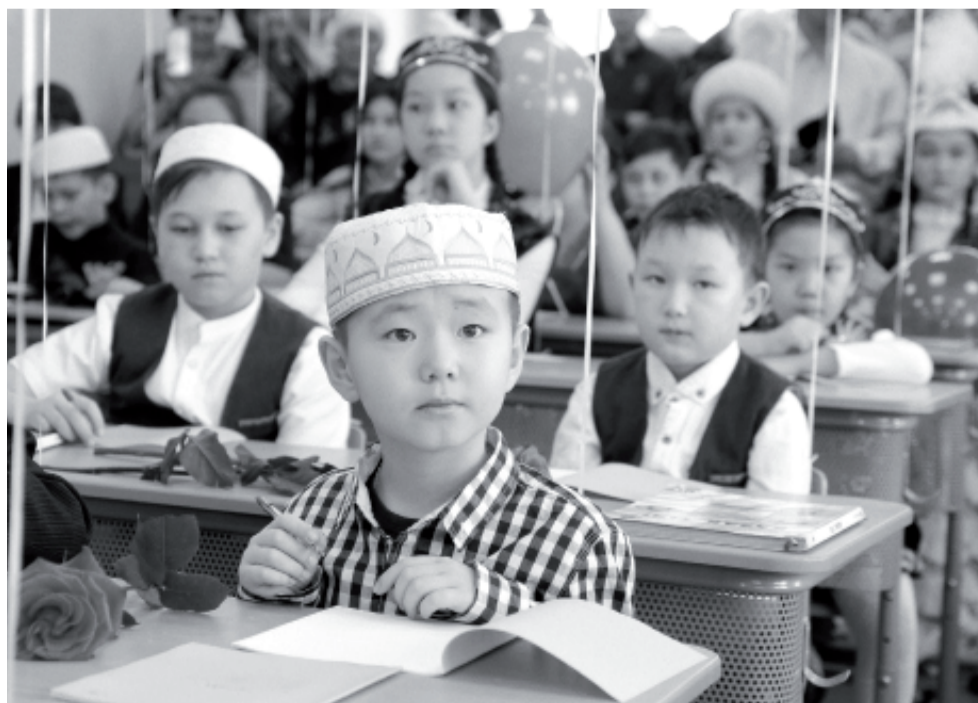
Первый класс казахского языка открыт в октябре 2019 года. Класс в Ишиме стал четвёртым – после Тюмени, Упоровского района и Голышмановского городского округа.

Зачин яркой концертной программы – казахский танец в исполнении хореографического ансамбля «Метелица» (руководитель Елена Кузурманова).