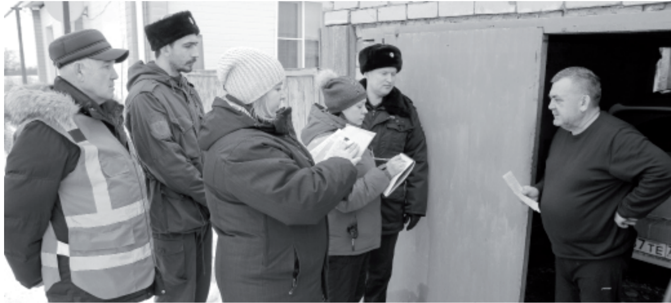
В минувшие выходные волонтеры прошли по улицам, расположенным вдоль берегов малых рек: Докучаева, Центральной, Тимирязева, Будённого, Костычева, Приозёрной, Солнечной, Луговой. Они раздали жителям памятки, как действовать и в какие службы обращаться за помощью во время паводка. // Фото Василия БАРАНОВА.

Большое влияние на уровень подъёма воды оказывает работа Сергеевского водохранилища в соседнем Казахстане. По предварительным консультативным прогнозам казахстанской стороны, объём влагозапа-