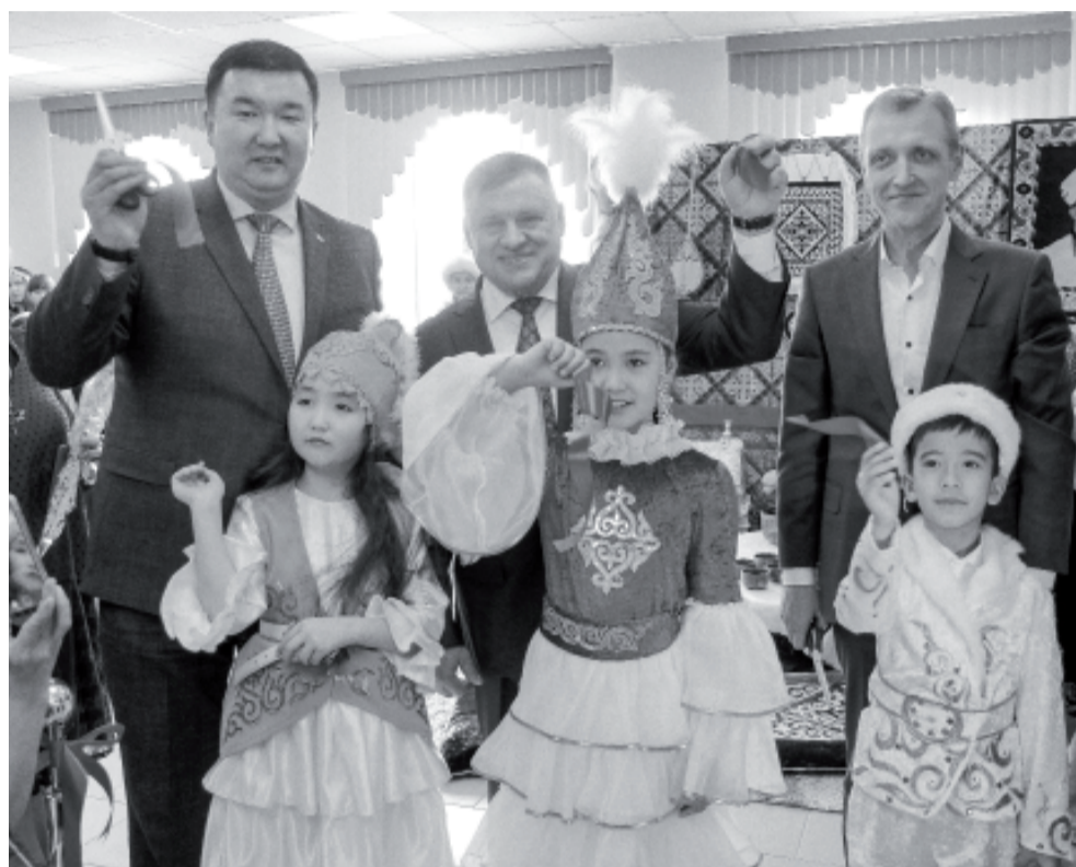
Факультативные языковые классы организованы при поддержке правительства Тюменской области и органов местного самоуправления в рамках реализации Стратегии государственной национальной политики России в Тюменской области.

– Развитие собственного языка важно каждому человеку, – убеждён Алексей Владимирович. – В семьях независимо от национальной принадлежности знание родного языка востребовано. Это – стержень всех по-