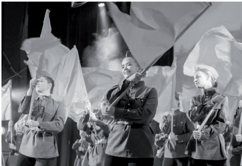
Зрители и участники торжественного открытия Года памяти и славы ещё раз перелистали летопись Великой Отечественной войны.

Концертная программа погрузила зрителей в атмосферу военного времени: 22 июня 1941 года, мобилизация, героизм женщин в годы войны, блокада Ленинграда, война и дети и, конечно, долгожданный День Победы. Горечь утрат и гордость за наш народ, победивший фашизм, благодарность поколению победителей – целую гамму чувств и эмоций испытали сидящие в зале, глядя на выступления артистов ГДК, воспитанников детского центра хореографического искусства, детской школы