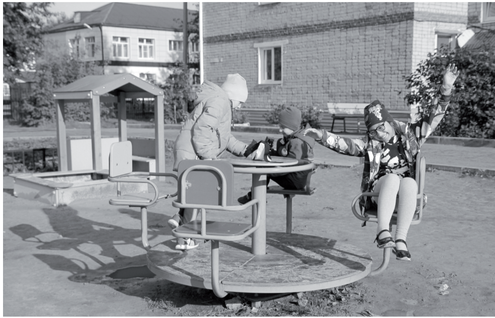
Дети довольны, взрослые спокойны. Дворы села Стрехнино обретают современный вид. В комплекс работ по благоустройству включают установку новых спортивных, игровых площадок.

Можно было оставить эти вопросы на решение жильцов во взаимодействии с управляющей компанией. Пошли по другому, более выгодному для всех варианту: при поддержке администрации Ишимского района администрация поселения провела организационную работу и включилась в областной проект по благоустройству