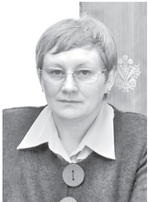
График приёма населения – 07.03.2016 г., 02.05.2016 г., 04.07.2016 г., 05.09.2016 г., 07.11.2016 г. по телефону – 8(3456)33-12-35.

При срочном обращении – ежедневно по рабочему телефону – 8(3456)33-12-25.