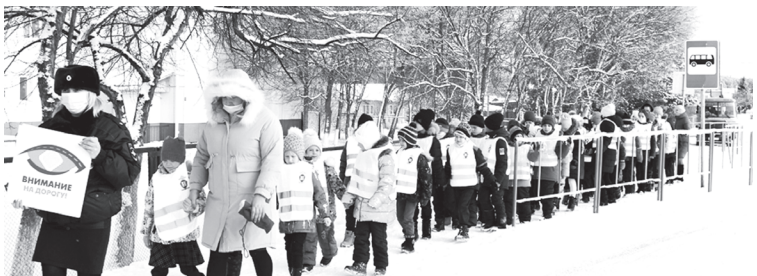
Младшие школьники повторили правила дорожной безопасности на практике

как правильно составлять схемы безопасных маршрутов от дома до школы, повторили, какие дорожные знаки информируют о месте расположения пешеходных переходов, объяснили, что в зимнее время значительно увеличивается тормозной путь автомобиля и потому увеличивается риск аварийных ситуаций, – уточнила старший инспектор по пропаганде БДД майор полиции