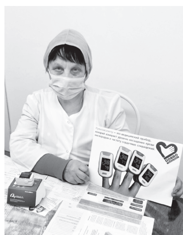
У волонтеров появились пульсоксиметры – приборы для измерения насыщенности крови кислородом

Ольга КОНОВАЛОВА