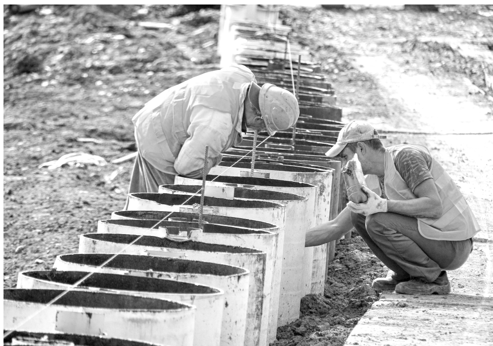
Укрепление дамбы по современным технологиям ведёт ООО «ПодъёмМост-Сервис», главный критерий деятельности которого — качество.