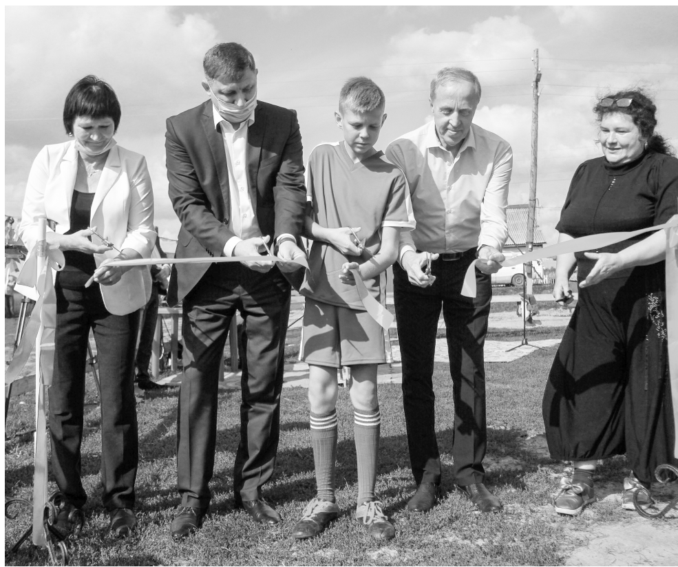
Ещё на один спортивный объект стало больше в Ишимском районе.

Наша газета писала, каким долгим был путь к этому спортивному празднику. Сначала активисты изучили практику на сайте президентских грантов, разработали проект с развёрнутым обоснованием, выполнили все