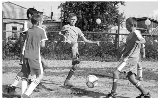
Спортивная площадка в Большеудалово стала любимым местом детворы.