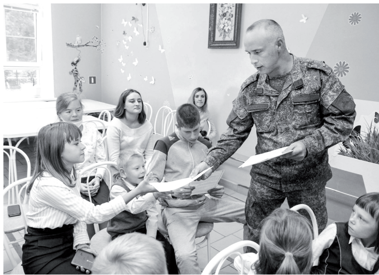
В 2005 году Федеральным законом «О днях воинской славы (победных днях) России» установлена новая памятная дата. 3 сентября, в День солидарности в борьбе с терроризмом, россияне с горечью вспоминают людей, ставших жертвами террористов, а также сотрудников правоохранительных органов, которые погибли при исполнении служебного долга.

— Когда идёт война, вооружённые стороны выступают друг против друга. При теракте всё намного страшнее: страдают в большинстве своём невинные люди, так как