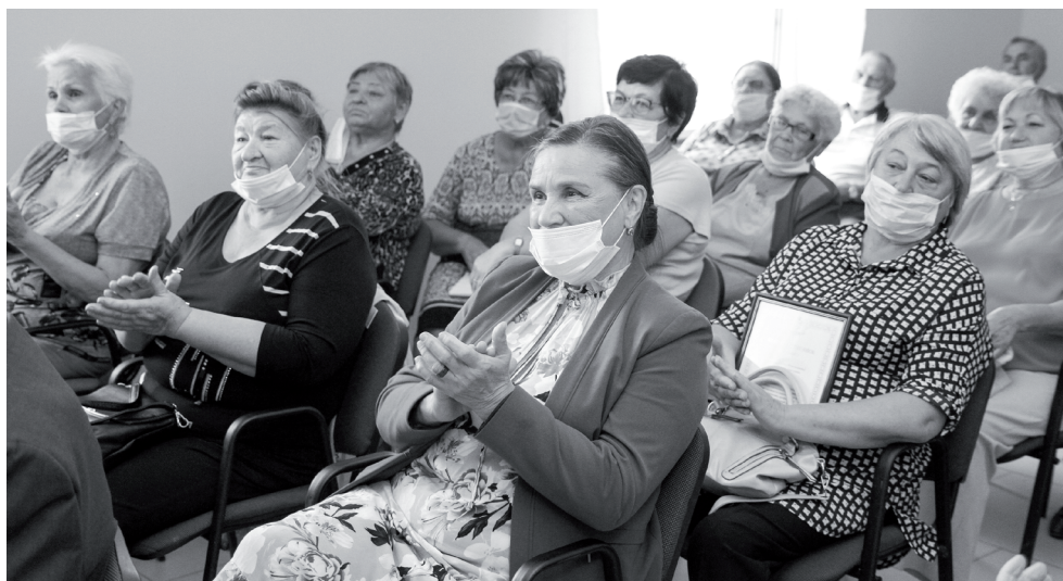
Члены общественного совета — люди неравнодушные, к их мнению прислушиваются в администрации города. // Фото Василия БАРАНОВА.

По-прежнему основными помощниками администрации города являются ТОСы. Этот институт местного самоуправления доказал свою востребованность и актуальность. Сразу два ТОСа заняли призовые места в областном конкурсе «Самый безопасный микрорайон». ТОС «Замимский» стал вторым, ТОС