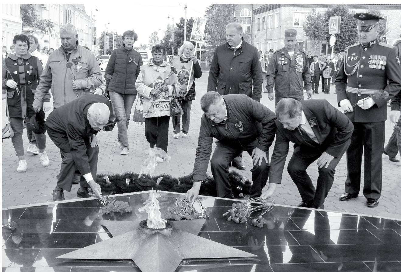
3 сентября, в День воинской славы, в Ишиме, как и во всех городах и сёлах нашей страны, прошли мероприятия, посвящённые окончанию Второй мировой войны.

В прошедший четверг в России отметили 75 лет со дня окончания Второй мировой войны.