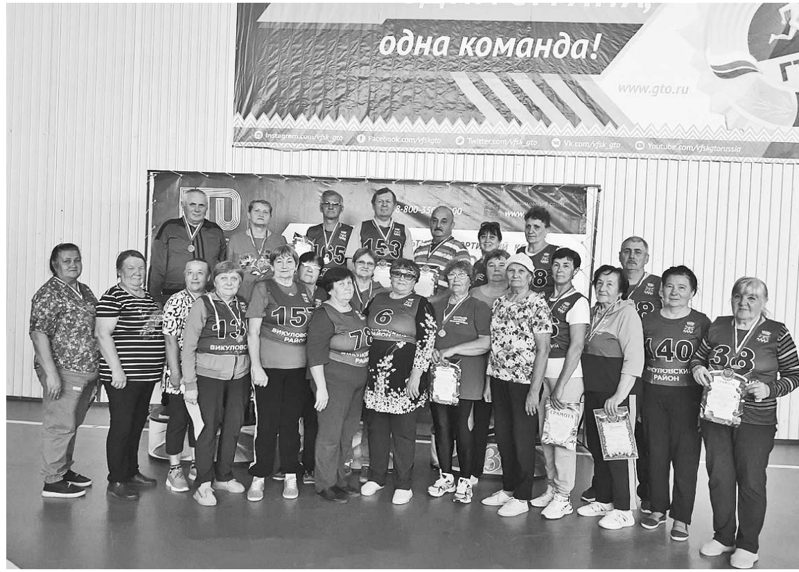
Участники и призёры фестиваля ГТО среди пенсионеров

занятия спортом всё больше граждан пожилого возраста. Наши люди активного возраста не сдают позиций, ведут здоровый образ жизни, а кто-то даст фору и молодым.