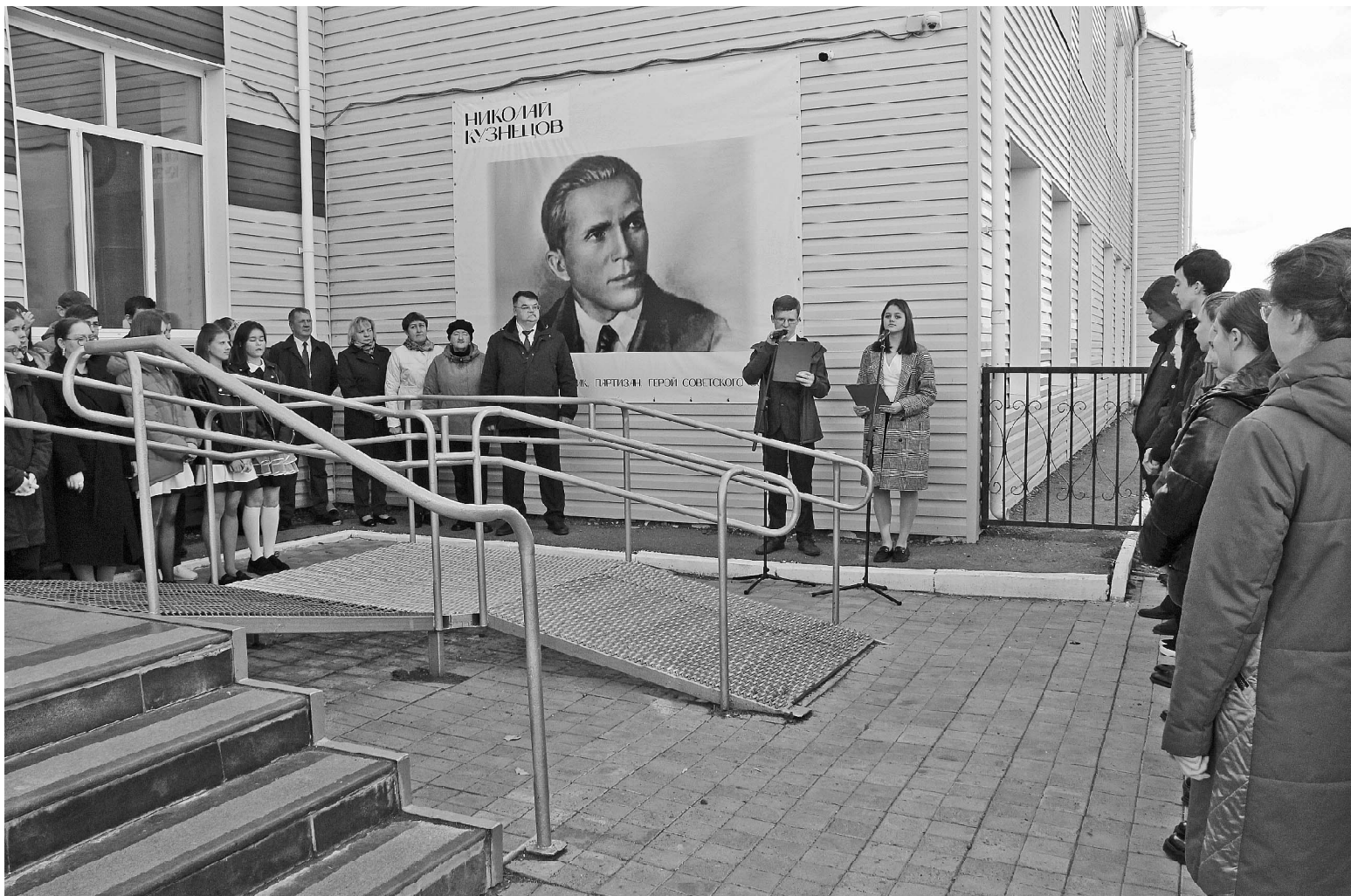
› Открытие баннера с портретом Героя Советского Союза Николая Кузнецова

Баннер с портретом Героя Советского Союза Николая Кузнецова открыт на фасаде здания Выкуловской школы №1. Фоторафия с портретом Героя открыта в рамках совместного проекта партии «Единая Россия» и Министерства просвещения РФ «Лица Героев», который призван познакомить детей и подростков с людьми разных поколений, совершивших подвиги на полях сражений и на трудовом фронте.