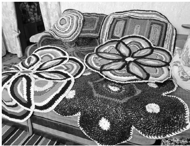
➤ Коврики ручной работы

ной газетой «Красная звезда» литературных конкурсов. В этом году её имя было в числе победителей конкурса «Расскажи о родине моей», посвящённого 100-летию Викуловского района, за присланные материалы.