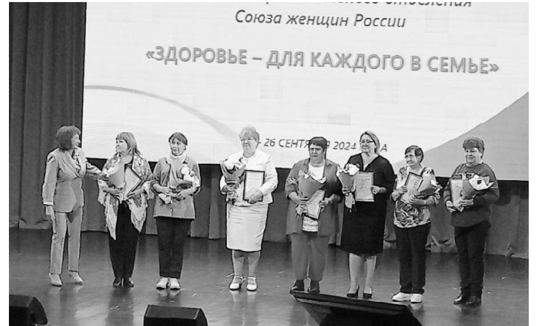
► Награждение активистов женского движения

Спикеры говорили с аудиторией на разные темы, но каждая из них касалась здорового