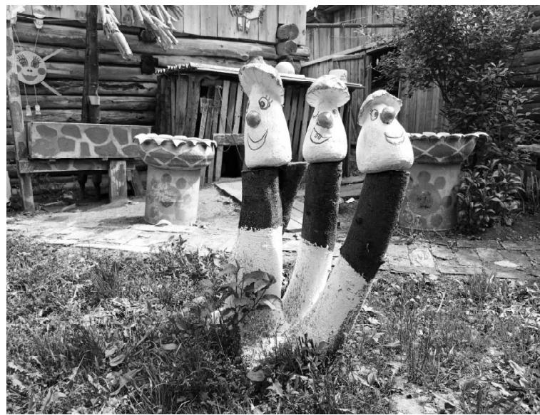
➤ Уличные поделки