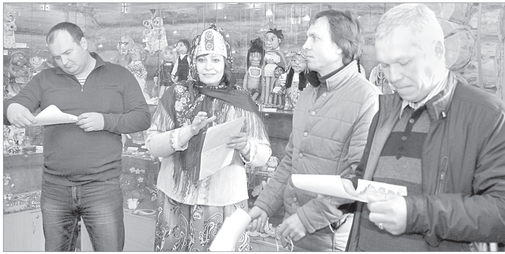
Купцы I гильдии - старейшины групп получают задание по разработке проекта