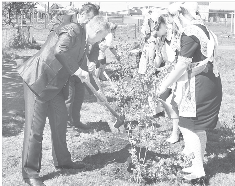
Деревца, посаженные одиннадцатиклассниками, будут напоминать им о школьных годах

Май – не просто один из самых красивых весенних месяцев, это, пожалуй, ещё и начало самого волнительного периода для выпускников.