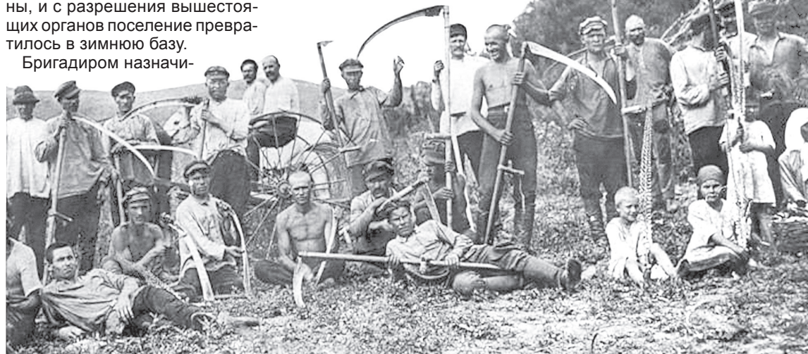
Корма заготавливали всем колхозом, а вот зимние заботы по содержанию скота ложились на плечи молодёжной бригады