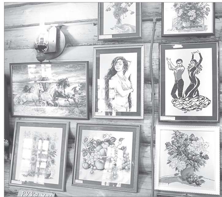
Вышивка крестом популярна у рукодельниц всего мира. Технология простая, но требует усидчивости и высокой концентрации внимания