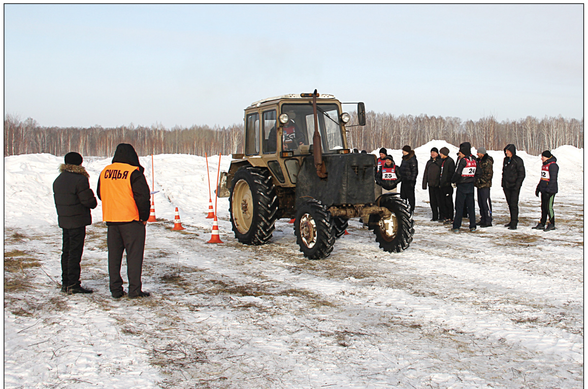
• В соревнованиях механизаторов участие принимали семь команд.

Заключительный этап 32 районных зимних сельских спортивных игр состоится 11 февраля в селе Сорочкино. Там пройдут соревнования по шахматам, армспорту, дартсу, крестьянской эстафете, семейные старты, покажут своё мастерство доярки.