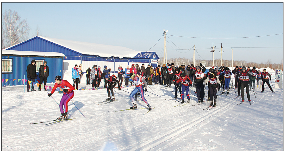
В массовом старте лыжников участвовали по десять мужских и женских команд со всего района.

В минувшую субботу в селе Аромашево состоялся первый этап районных зимних сельских спортивных игр. В программу первого дня были включены: соревнования механизаторов, охотничий биатлон, полиатлон и лыжные гонки среди мужчин и женщин.