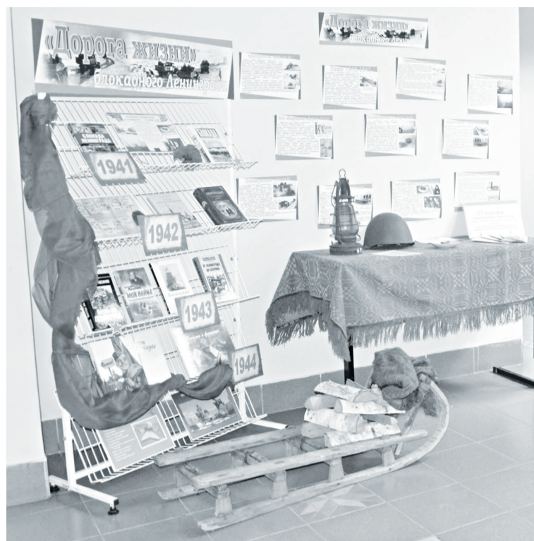
Экспозиция в районной библиотеке ждёт посетителей.

Жители района традиционно отмечают важную дату истории. Накануне 80-летнего юбилея снятия блокады Ленинграда в библиотеках организованы книжные выставки. Школьников приглашают на уроки мужества. В Суерке местный совет ветеранов организовал встречу пенсионе-