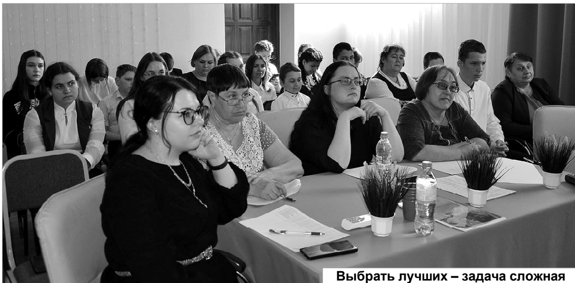
Выбрать лучших – задача сложная