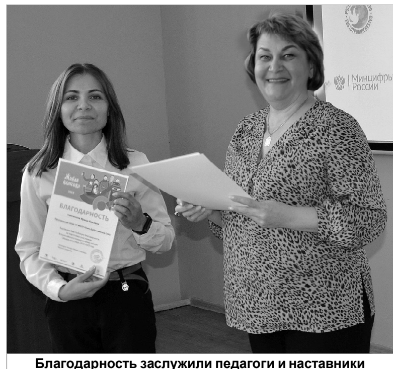
Благодарность заслужили педагоги и наставники