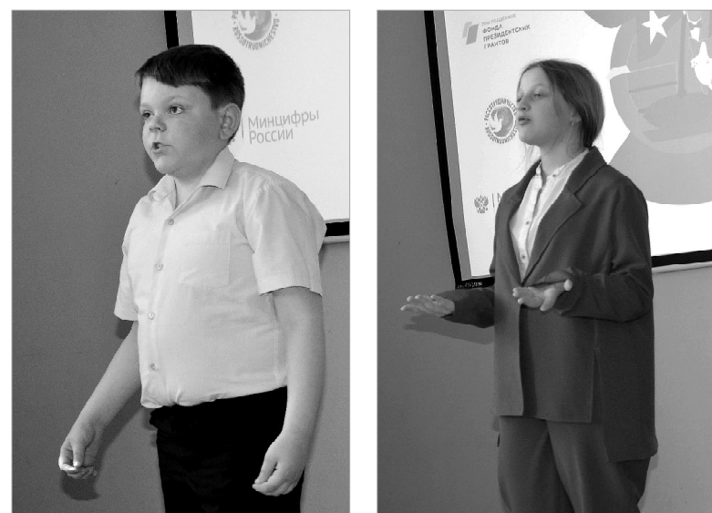
Каждое выступление достойно высокой оценки

И вот настал самый волнительный момент конкурса – подведение итогов и награждение.