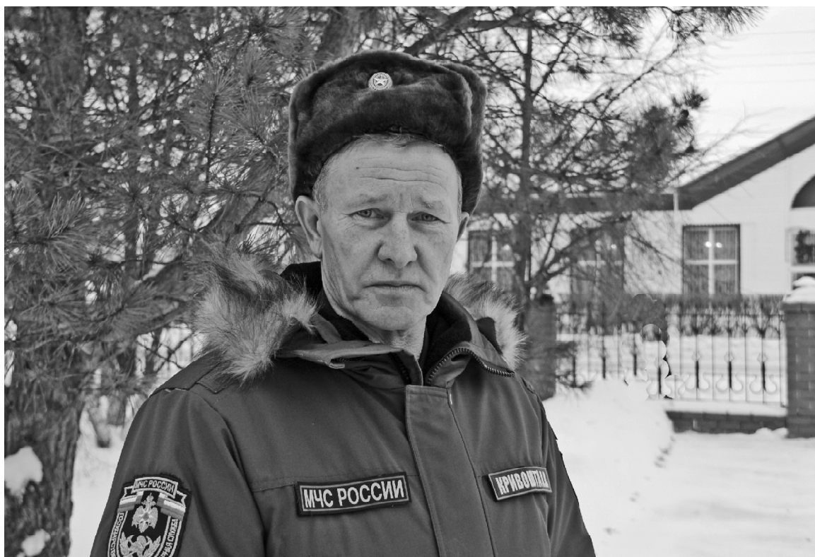
► Павел Кривошта // Фото автора

Для тех, кто служит в МЧС, нет лёгких смен и сезонных работ, помощь может понадобиться в любое время. А это значит, что работники службы должны быть всегда в боевой готовности.