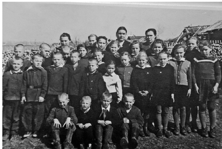
► Юшковская начальная школа, 1967 г.