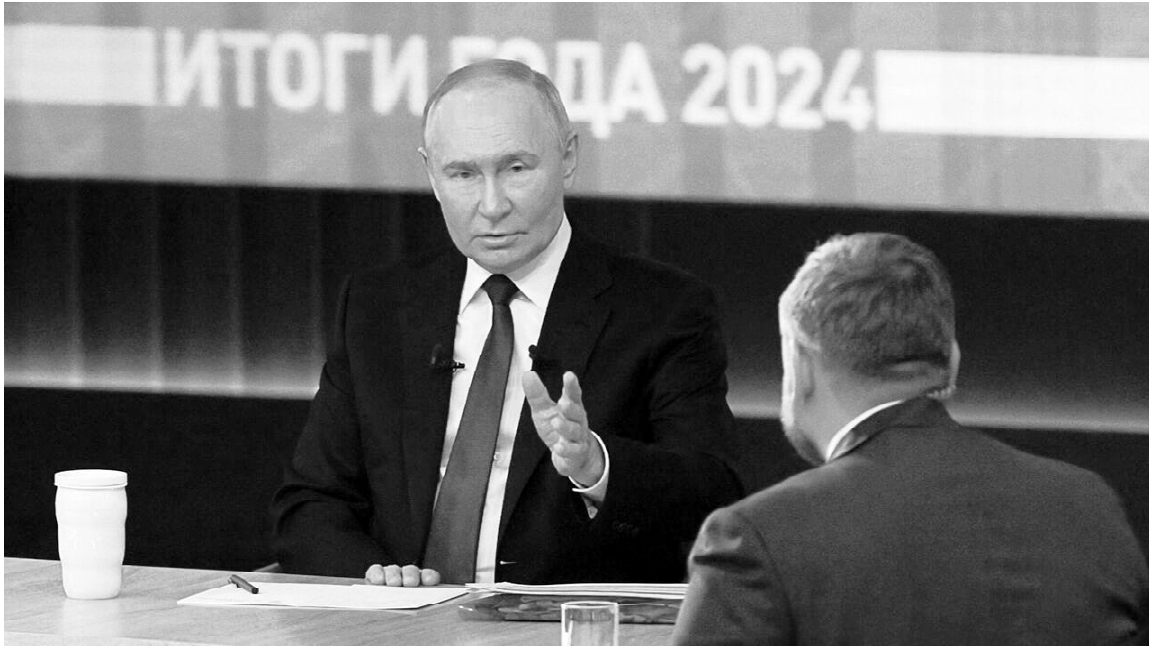
▶ Владимир Путин отвечает на вопросы россиян

«Итоги года» с президентом 19 декабря в прямом эфире продлились 4,5 часа.