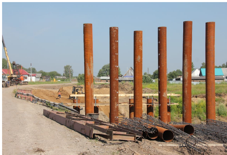
➤ Работы по погружению сваеоболочек.