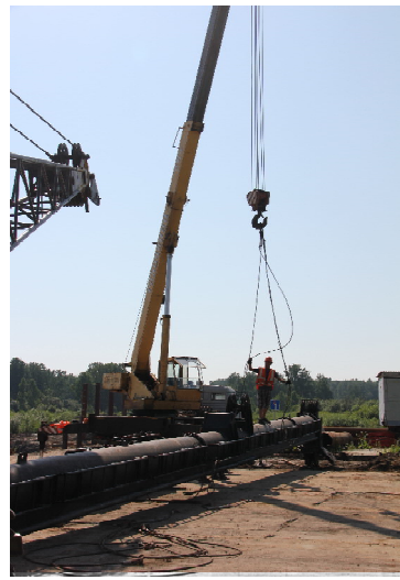
➤ Идёт сборка сваепогружателей.