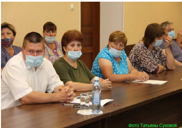
Во время встречи с главами поселений и депутатами районной Думы