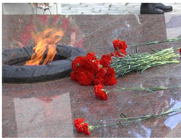
➤ Идёт возложение венков к Мемориалу Славы от предприятий и организаций района

• ГИМС сообщает — Зарегистрировать или платить штраф?