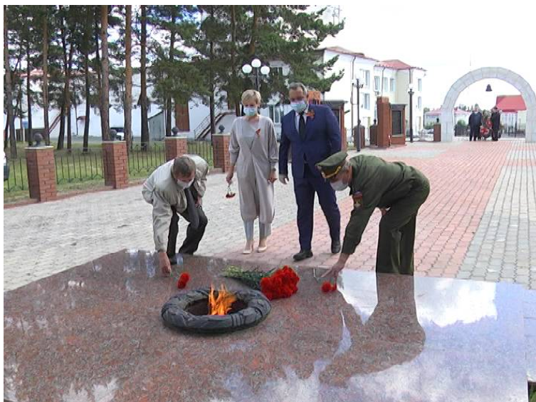
➤ Глава района и представители администрации

С 2020 года в России в День памяти и скорби будет проводиться ежегодная общероссийская минута молчания. Она будет проходить одновременно во всех регионах страны в 12.15 по московскому времени. Это точное время выхода в эфир обращения к гражданам о нападении нацистской Германии на Советский Союз.