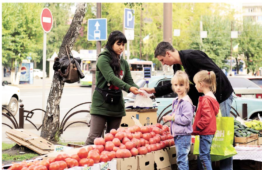
На торговлю излишками с дачи это не похоже. Но почему никто не принимает меры?

В борьбе с уличными торговцами городские власти проигрывают.