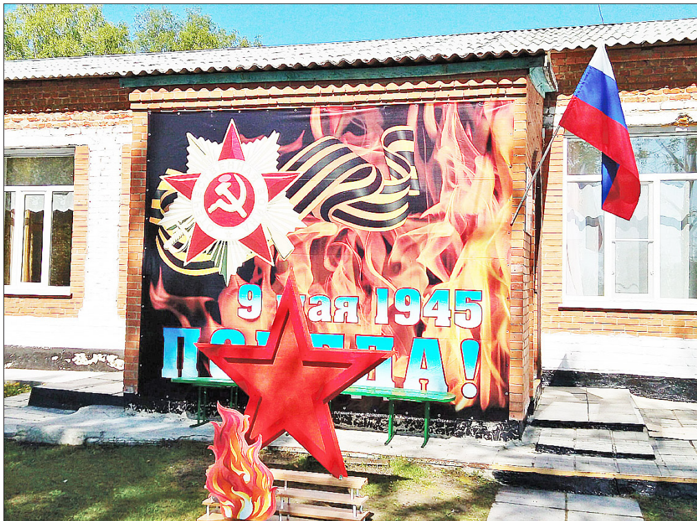
Так была украшена ко Дню Победы территория Пешнёвской школы