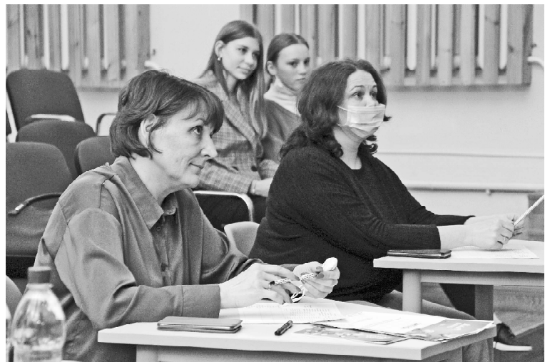
» Жюри конкурса

«Чернильное сердце», «Три толстяка», «Класс коррекции», «Повесть о настоящем человеке», «Два письма»... Ребята старались раскрыть суть отрывков произведений, вжиться в роль рассказчиков, эмоционально выступить на сцене. Победите-