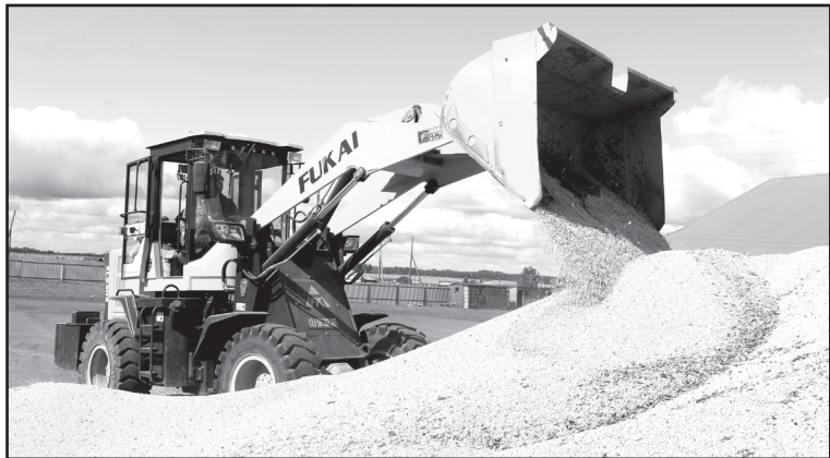
На площадке работает фронтальный погрузчик «Fukai», водитель Фёдор Лёвочкин

Ольга КОНОВАЛОВА