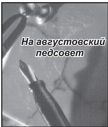
На августовский педсовет

– Учебными пособиями дети полностью обеспечены. Педагогический коллектив в составе семи человек остаётся неизменным. На полную учебную нагрузку выходит Елена Ферапонтова, учитель технологии. В этом году на заслуженный отдых проводили Наталью Васильевну Колобову, в связи с чем столкнулись с ка-