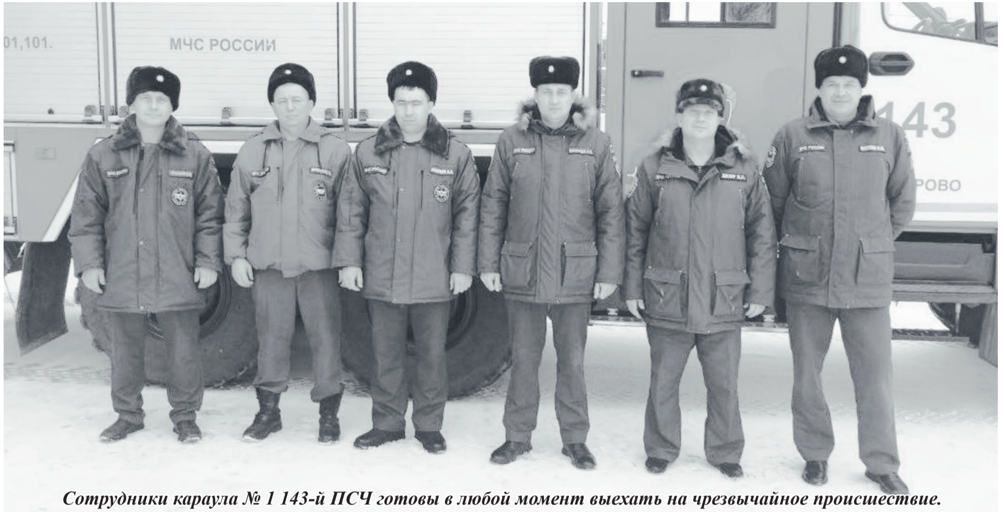
Сотрудники караула № 1 143-й ПСЧ готовы в любой момент выехать на чрезвычайное происшествие.