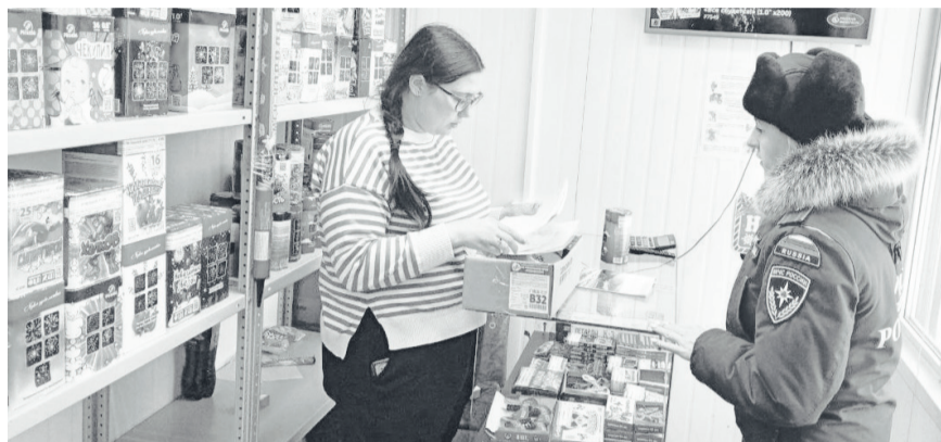
Сотрудники МЧС проверяют документацию на соответствие нормам пиротехнической продукции.