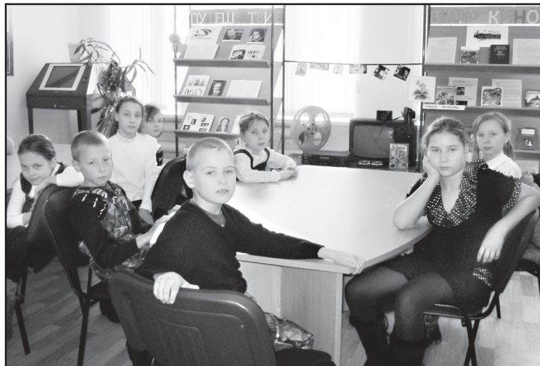
В Шипаковской сельской библиотеке