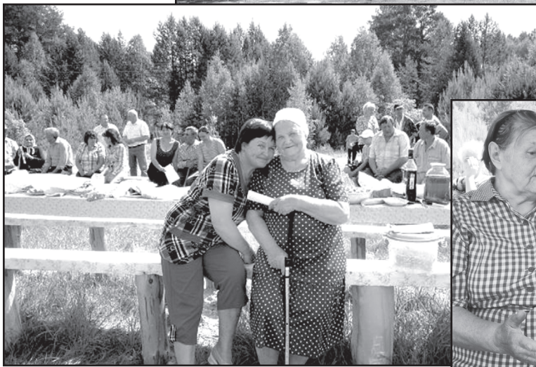
Встречи на Троицкую субботу в Бучихе