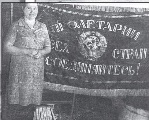
Бучинская библиотека три года удерживала переходящее Красное знамя райкома КПСС