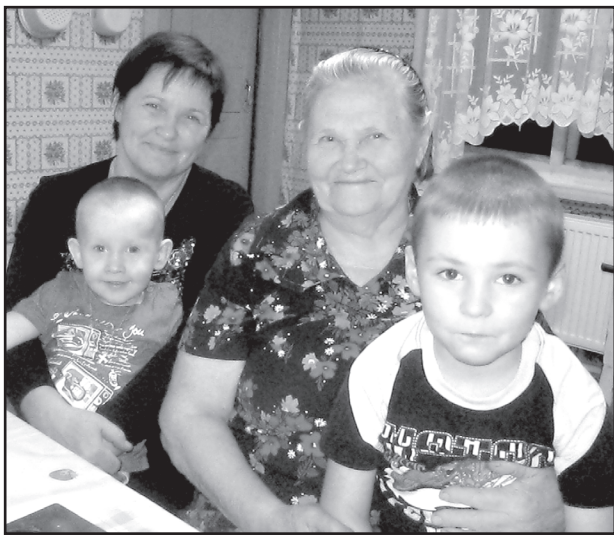
С дочерью и внуками