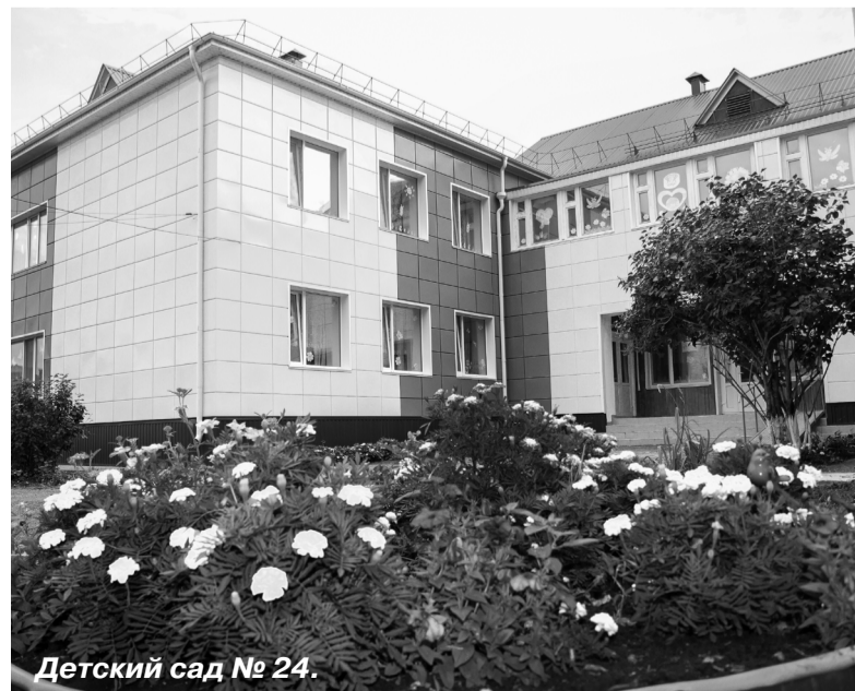
Детский сад № 24.

Людмила МАРИКОВА.