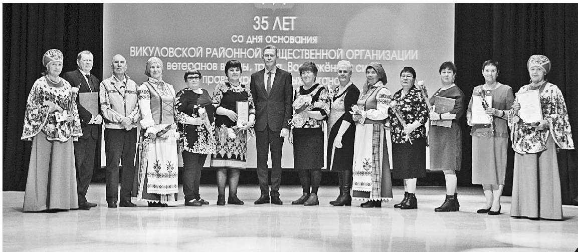
➤ Поздравление от Александра Моторина