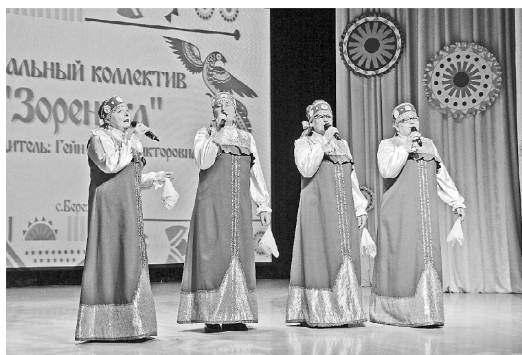
➤ С. Березино

Выступление вокалистов чередуется с танцевальными номерами. Профессионально отточены движения у солисток образцового любительского ансамбля «Фиеста» (Викуловский РДК), любое выступление этого коллектива — праздник! Оригинально в своём танце трио «Сюит» (с.Березино),