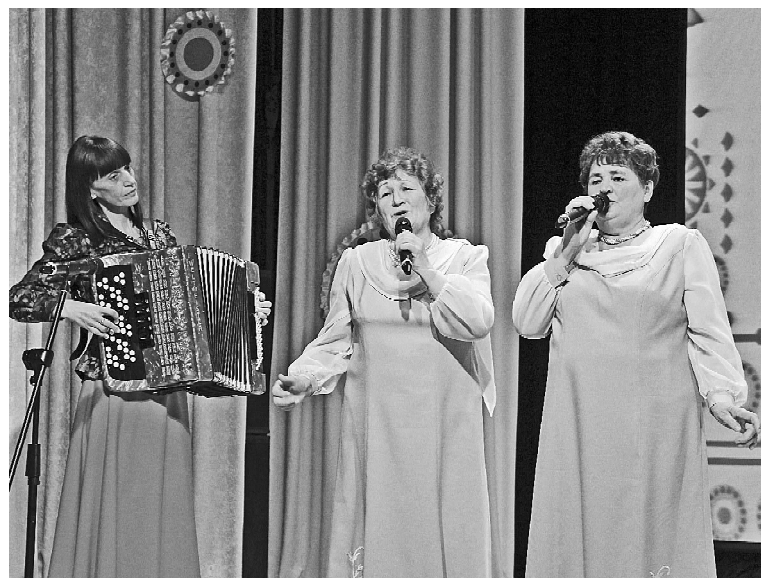
➤ Дуэт с. Рябово