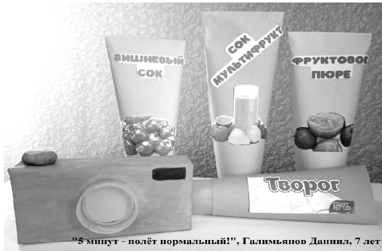
"5 минут – полёт нормальный!", Галимьянов Даниил, 7 лет