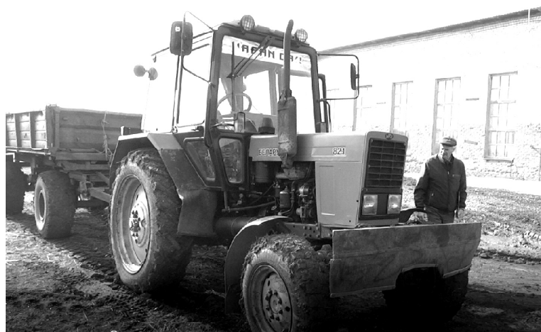
➤ Идёт техосмотр

В сельхозпредприятиях Викуловского района проходят взаимопроверки по готовности техники, обеспеченности семенами и минеральными удобрениями. В состав комиссии входят специалисты управления сельского хозяйства, инспектор Гостехнадзора и сотрудники других ведомств.