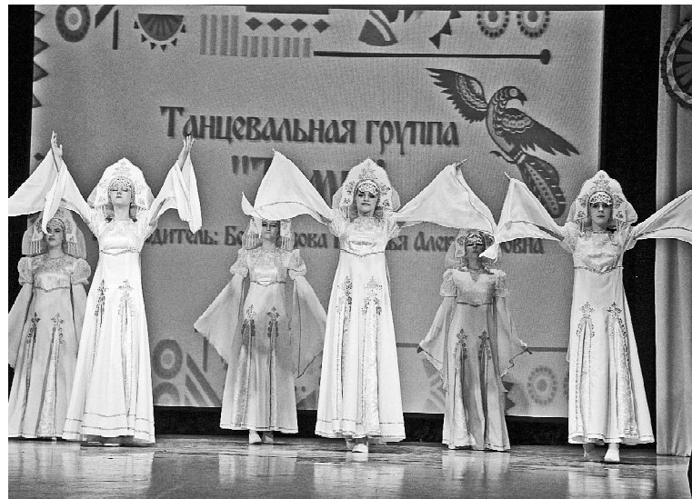
➤ Танцевальная группа «Темп»