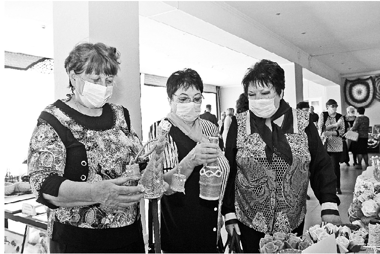
➤ На выставке