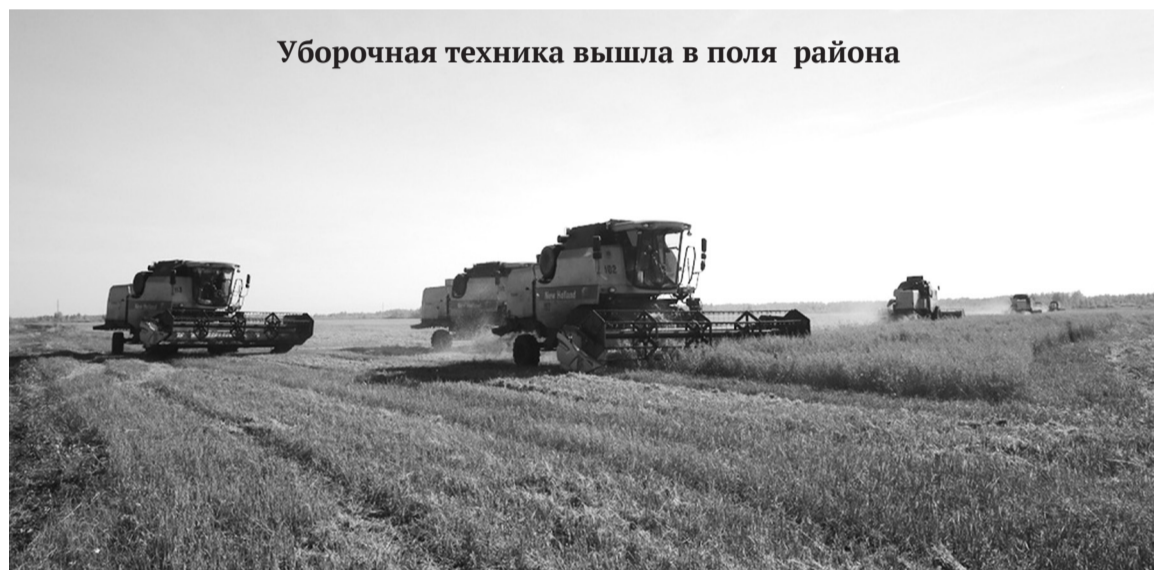
Уборочная техника вышла в поля района

Необходимо убрать урожай с 24396 гектаров, пока обмолочено только 3929 га (16%).