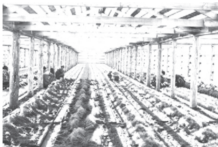
Хорошим подспорьем для лесовосстановительных работ служит собственная теплица, где выращивается свой посадочный материал.