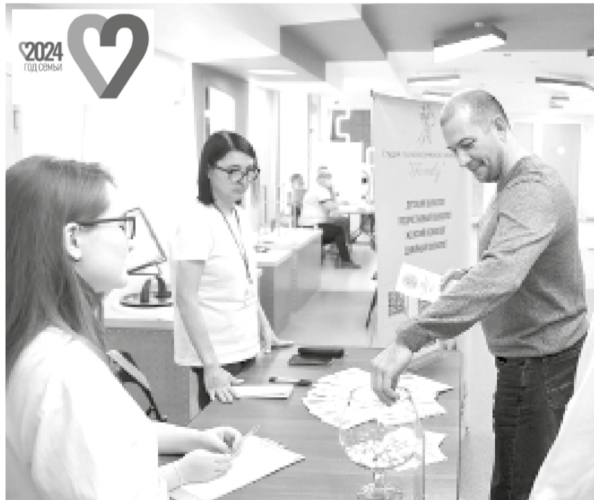
► Во время форума работали разные площадки, в том числе студия психологического консультирования