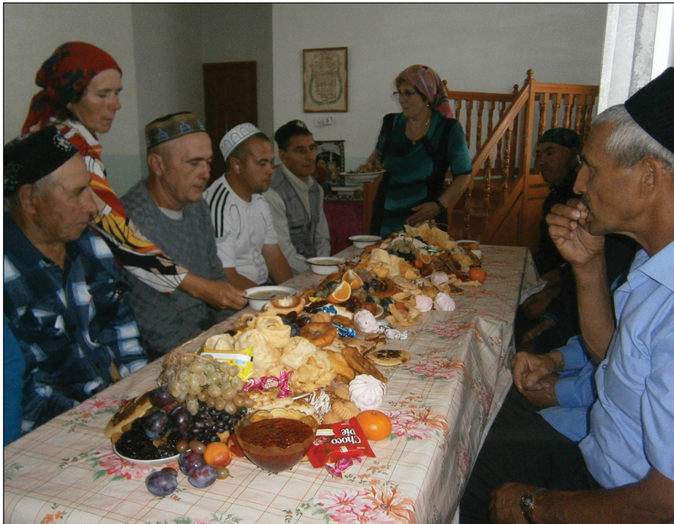
• Курбан-байрам в Новоаптуле встретили за общим застольем.