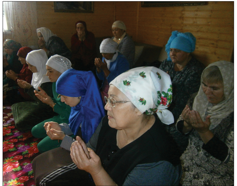
• Новоюртинские женщины во время совершения праздничного намаза.