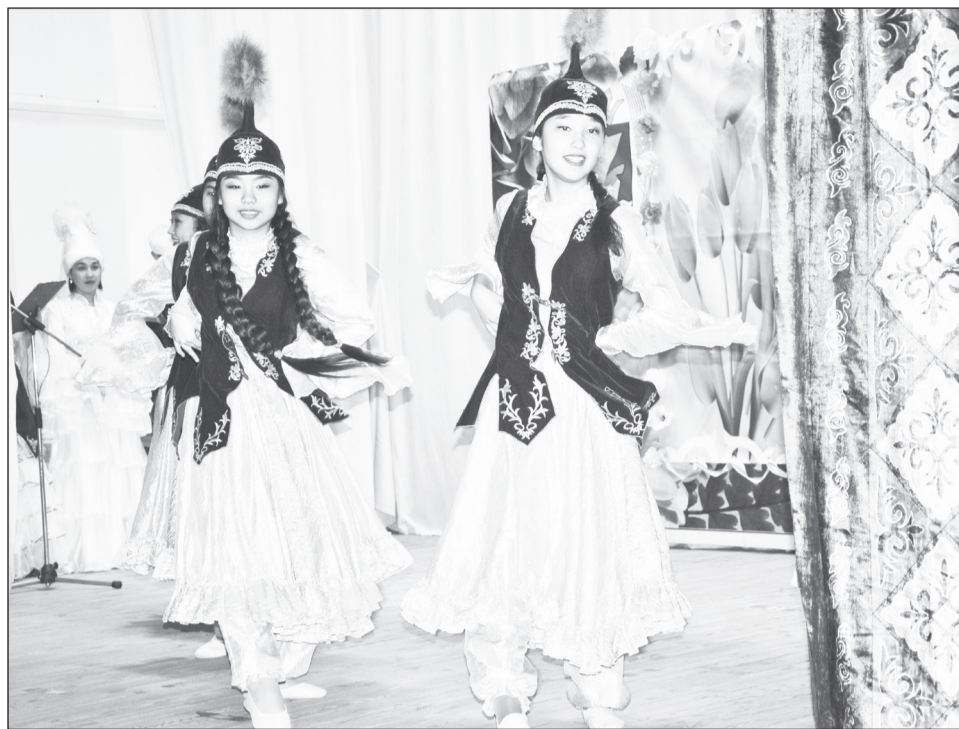
Зажигательный казахский танец.