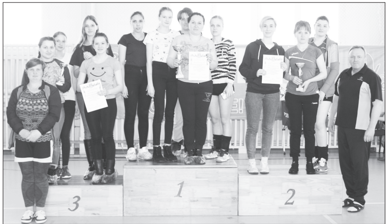
Призёры 2 лиги.

Состязания прошли на высоком уровне, все игры были напряжённые и интересные.