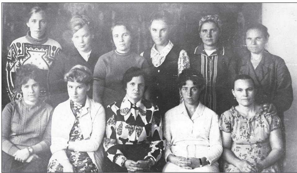
Коллектив школы в 70-х годах.

Каждый проработавший в школе учитель оставил свой след в истории и в сердцах учеников. Много сил и душевного тепла отдали своей рабо-