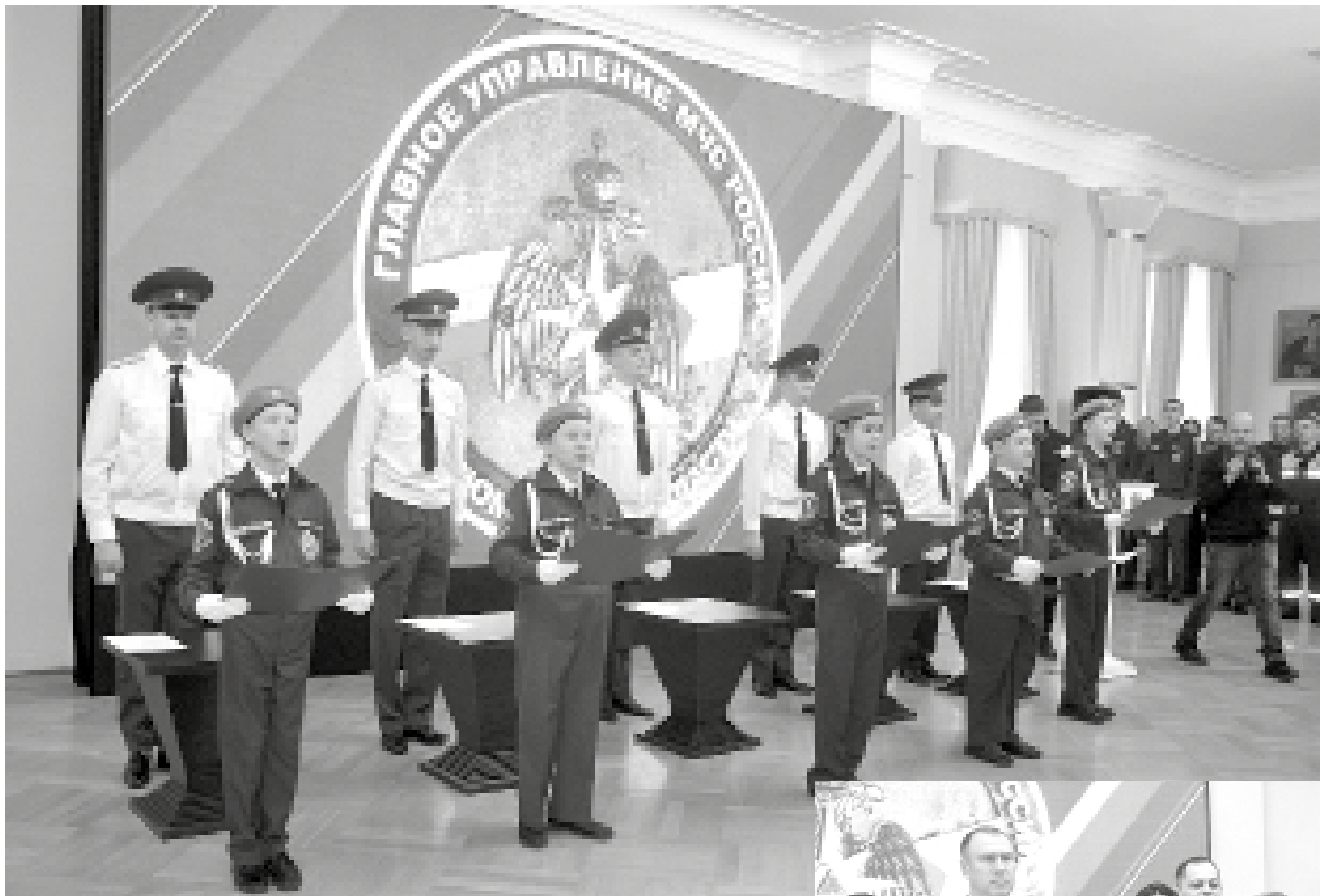
► И под дворцовыми сводами грянуло «Служу России!»

Во Дворце наместника состоялась торжественная церемония, посвящённая принятию присяги кадетами МЧС России Тобольска, учащимися 5 класса школы № 5