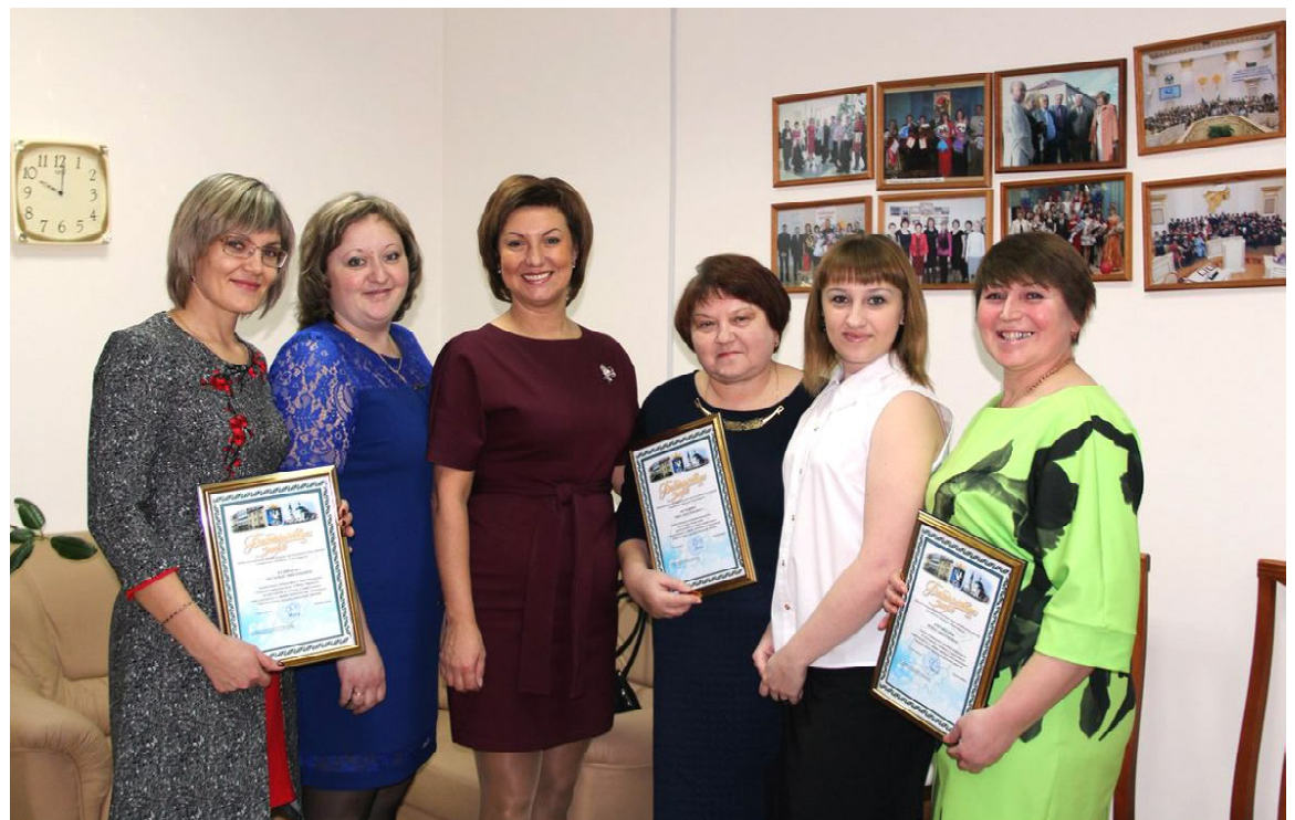
На церемонии награждения