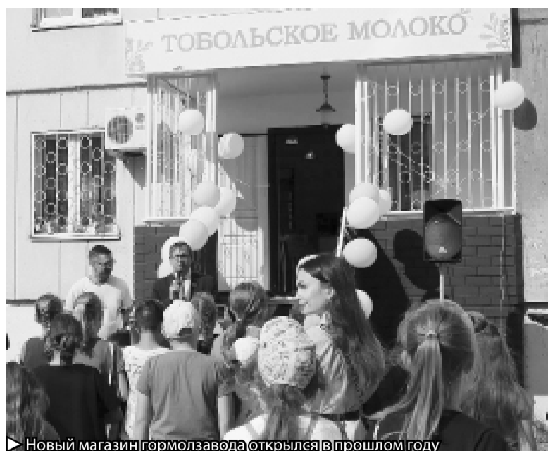
Новый магазин гормолзавода открылся в прошлом году

Тобольский городской молочный завод — высокотехнологическое предприятие с полувековой историей, лауреат конкурсов «Лучшие товары и услуги Тюменской области», «100 лучших товаров России». Обеспечивает качественной молочной продукцией жителей и предприятия социальной сферы (детские сады, школы) города, области, ХМАО и ЯНАО. Мощность переработки составляет 30 тонн сырья в сутки, из которого