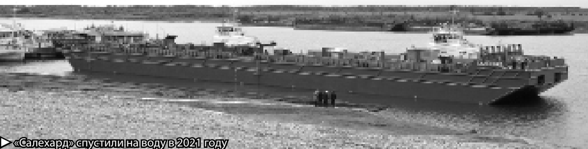
«Салехард» спустили на воду в 2021 году

— серийный выпуск 20 судов. На предприятии ежегодно растёт численность сотрудников, индексируется заработная плата. На сегодня здесь трудится порядка 400 человек.