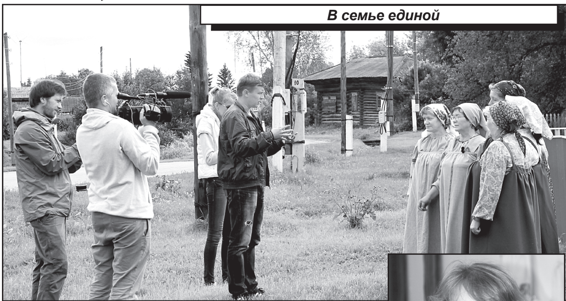
В семье единой

В это время режиссёр Михаил Скотников и операторы Андрей Митрофанов и Владимир Родионов готовили аппаратуру: сосредоточено устанавливали камеры в помещении, обустро-