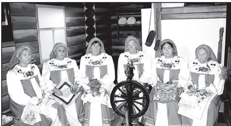
Фольклорный ансамбль «Ивушка»

енном под русскую избу, проверяли освещение, обговаривали все моменты записи с фольклорным ансамблем «Ивушка» из сельского Дома культуры «Строитель». А затем женщины в русских национальных сарафанах исполняли старинные проговорные песни. Задушевно, прочувствованно –