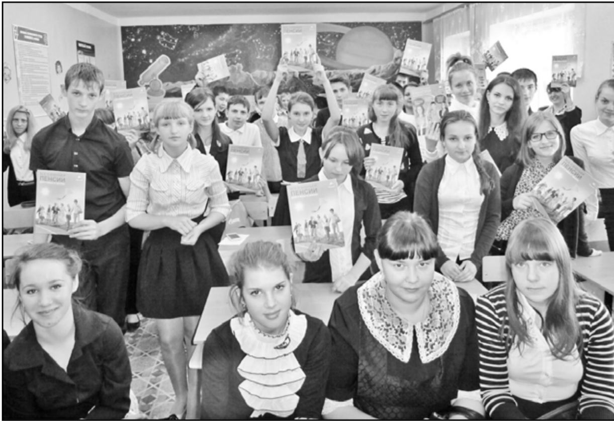
Подаренные пособия помогут ребятам разобраться во взрослой жизни