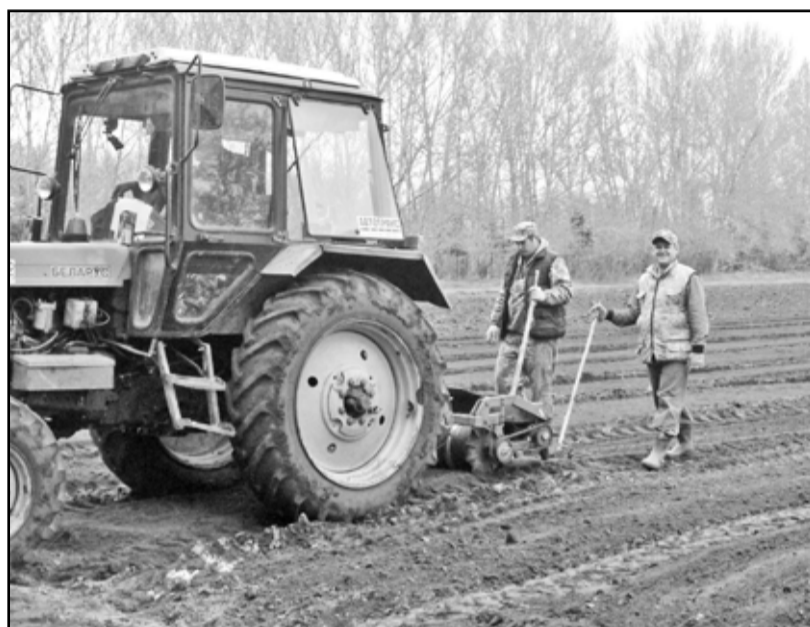
Труд лесоводов механизирован

Начальник отдела «Казанское лесничество» управления лесничествами департамента лесного