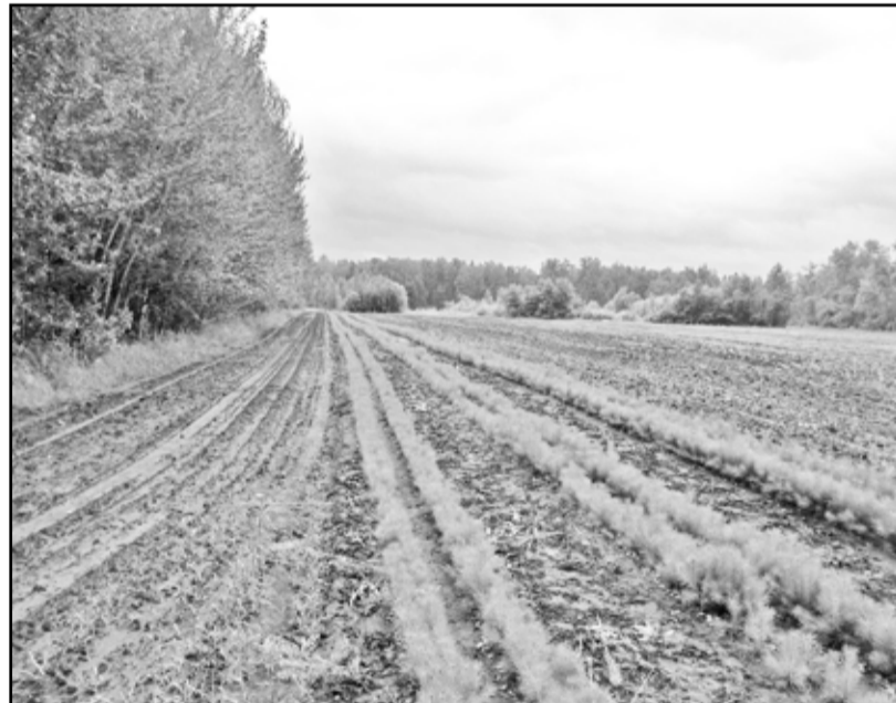
Лес не только вырубается, но и восстанавливается