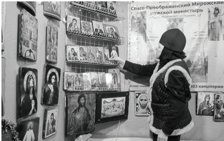
Позаботиться не только о хлебе насущном, но и своей душе – главный посыл проведения православных выставок-ярмарок. Этой традиции в России уже более 100 лет.

Не была забыта и пища телесная. На выставке-ярмарке предлагали камчатскую солёную и копчёную рыбу, мёд, халву, орехи, сухофрукты и непродовольственные товары: