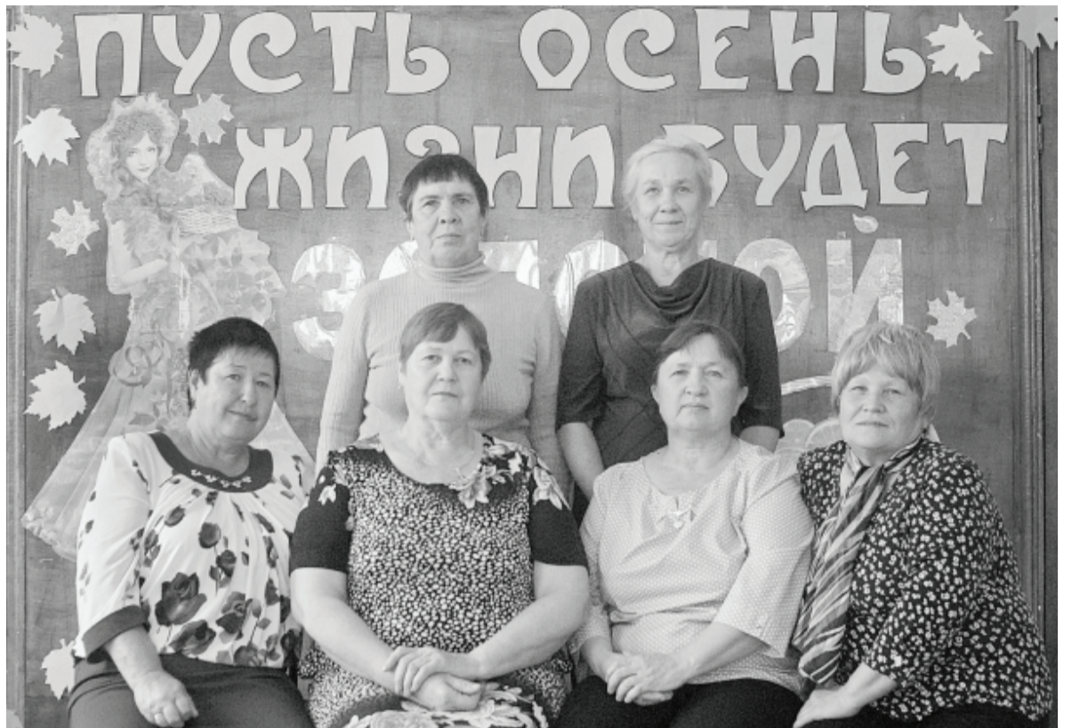
Под руководством совета первичная ветеранская организация села Гагарино – одна из активных в Ишимском районе.

Организация общественных обсуждений материалов государственной экологической экспертизы относится к полномочиям органов местного самоуправления городских округов и муниципальных районов.