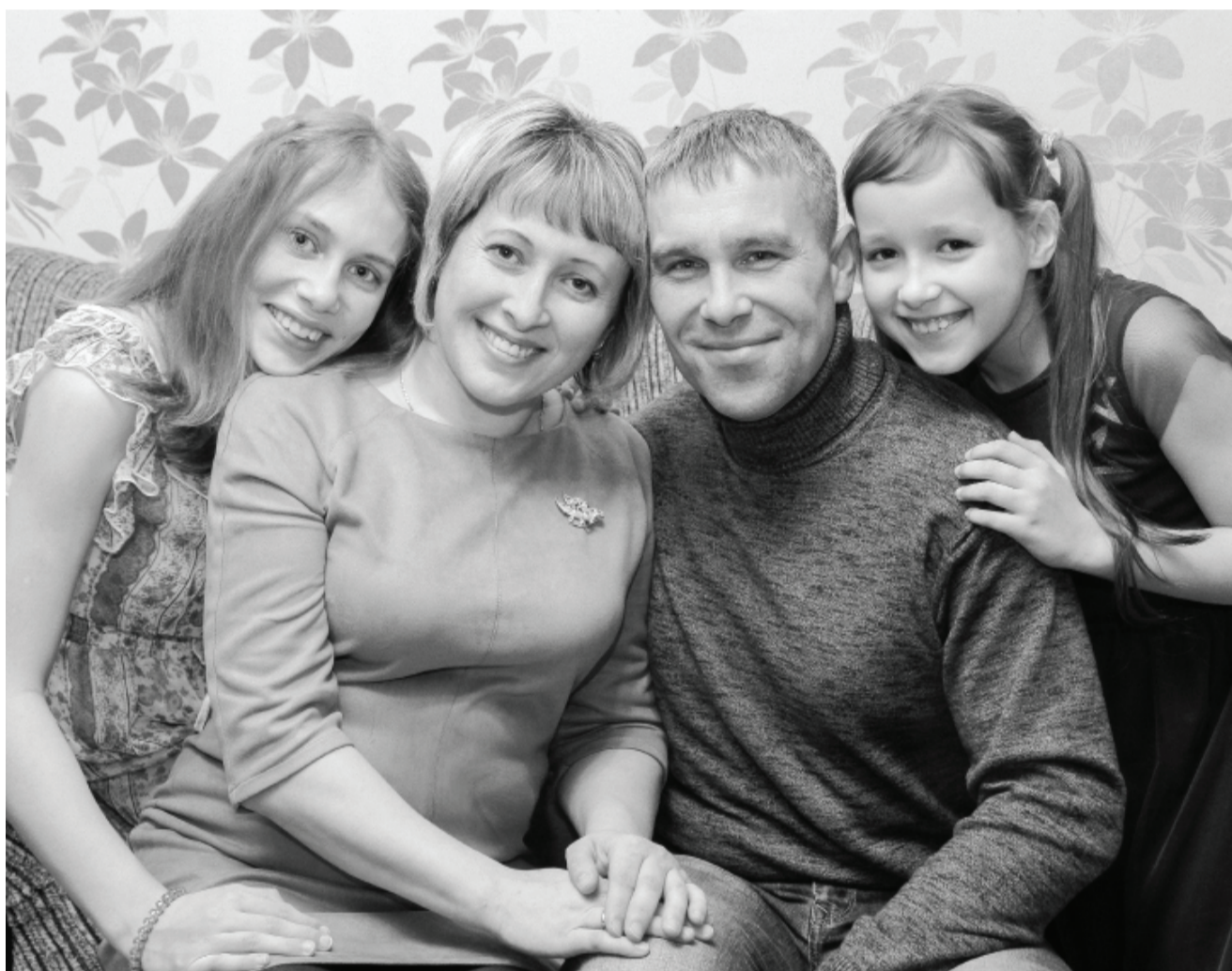
Глядя на эти счастливые лица, понимаешь: миром правит любовь. Важно её сохранить, пронести сквозь годы.

УВАЖАЕМЫЕ ЧИТАТЕЛИ! НАПОМИНАЕМ: ПОГОДА ПЕРЕМЕНЧИВА.