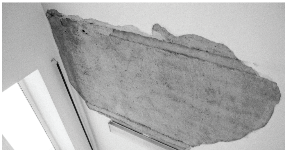
Слой штукатурки площадью около полутора квадратных метров обрушился с потолка в коридоре на третьем этаже.

– Сформирована межведомственная комиссия, в которую вошли представители департаментов администрации города, проектной организации, МЧС, родительской общности – в течение дня они повторно осматривают корпус, выявляя возможные риски, формируют предложения по их исключе-