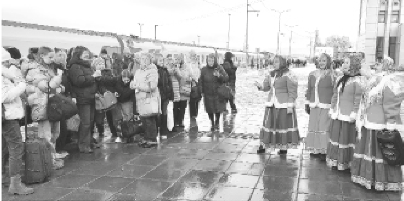
► Первых туристов по маршруту «Тобольск – ключ к Сибири» встречают на перроне жд вокзала

В осенние каникулы отправились в Сибирь по доброй воле порядка 450 жителей Челябинской области. Их путешествие по двум сибирским городам – Тюмени и Тобольску – состоялось на специальном туристическом поезде из 10 вагонов по направлению «Челябинск – Тюмень – Тобольск – Челябинск». Этот туристический проект под названием «Дорогами открытий» родился благодаря сотрудничеству Агентства туризма и продвижения Тюменской области и Центра проектного развития Челябинской области при поддержке Уральского филиала АО «Федеральная пассажирская компания».