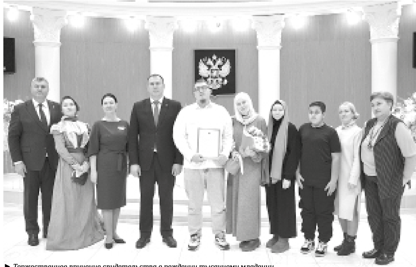
► Торжественное вручение свидетельства о рождении тысячному младенцу

– Дорогие друзья, впервые в жизни участвую в таком замечательном, волнительном мероприятии. То, что ваша дочь стала тысячным новорождённым ребёнком – это чудо. И говорит о том,