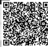
► Побывать на уроке с Менделеевым

Интерактивные уроки химии с использованием искусственного интеллекта прошли более чем в 600 классах российских школ в 30 городах страны. В них приняли участие 15 000 школьников и 472 амбассадора компании