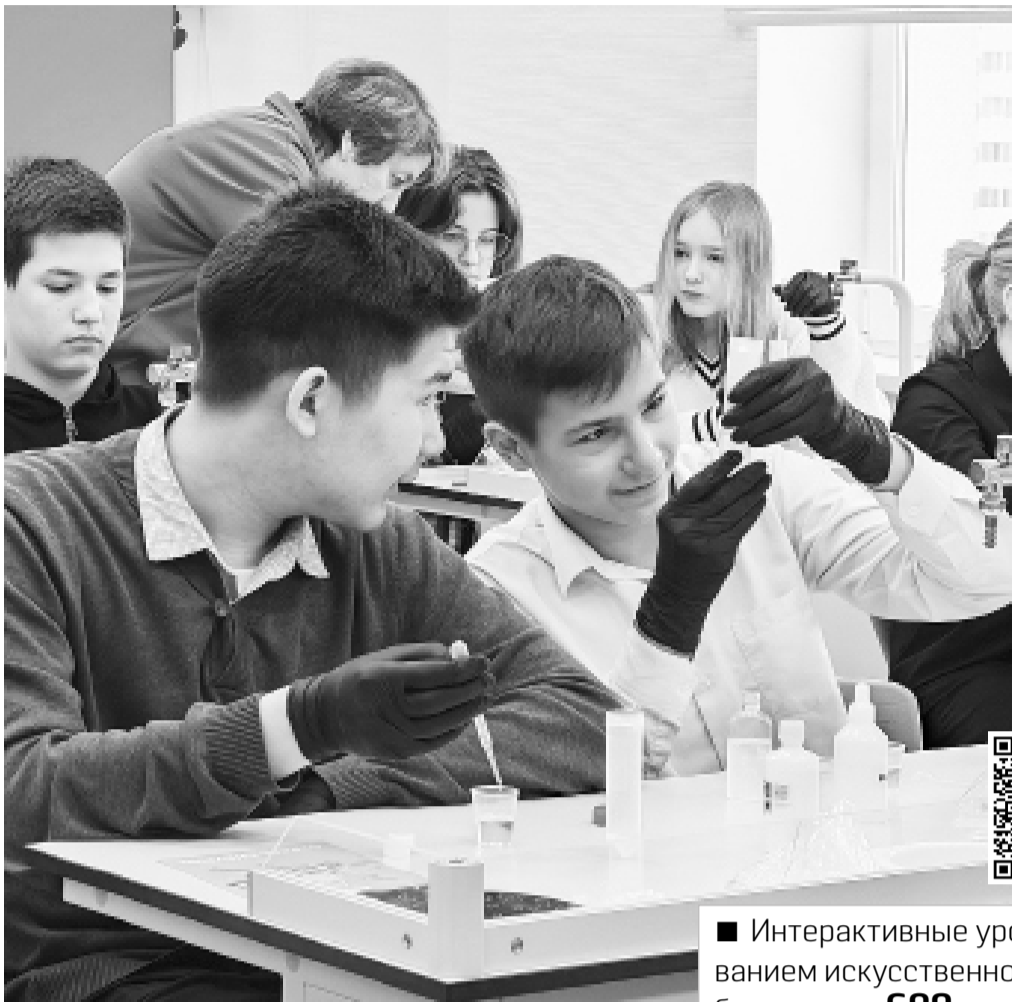
► В ожидании «Египетской ночи»

– В рамках «Менделеевской смены» мы показываем, что химия – интересная наука, это не только сложные задачи и огромные цепочки формул. И обязательно кто-то после этих уроков