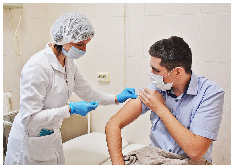
В этом году вакцинацию от коронавируса прошли и подростки

Если в течение последних 14 дней у пациента был контакт с инфицированным коронавирусом или наблюдались симптомы ОРВИ (кашель, температура, общее недомогание), вакцинацию переносят на другое время. Также