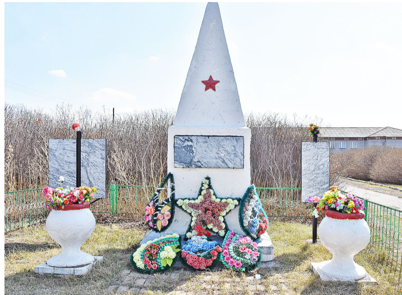
Копотиловцы следят за состоянием памятника. За каждой фамилией – своя история

За памятником ухаживают школьники. Ежегодно 9 Мая здесь проходит митинг, на который соби-