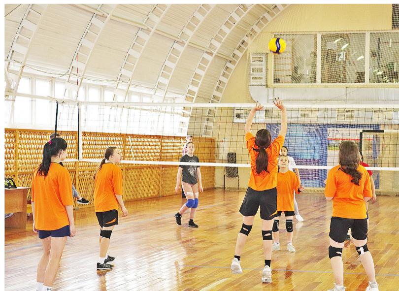
В соревнованиях «Весенняя капель» приняли участие около ста юниоров из семи школ Казанского района