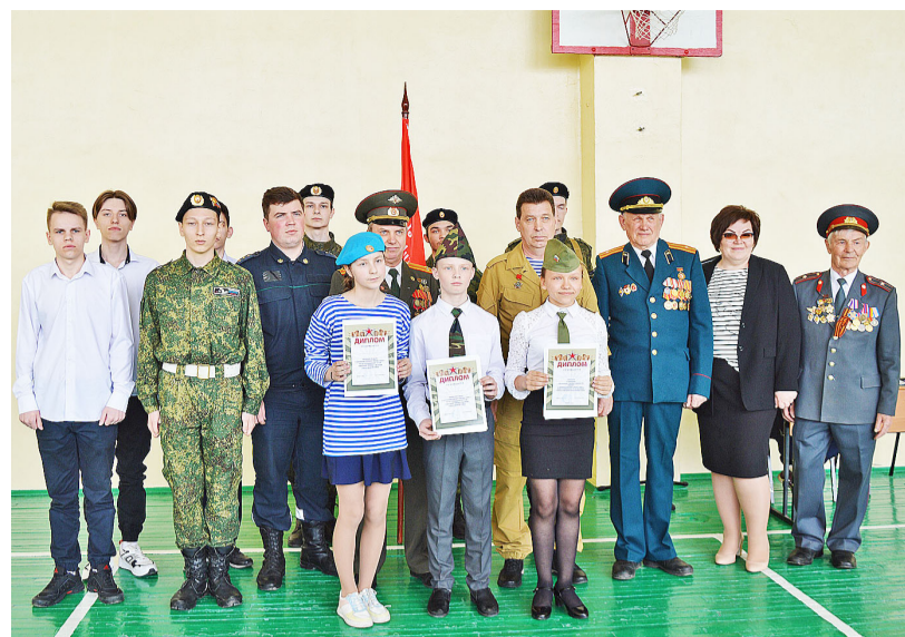
Командирам отрядов в торжественной обстановке вручили дипломы

Приятно было наблюдать, как школьники, волнуясь, маршировали на месте под известную солдатскую песню и двигались по залу строевым шагом, попадая в ритм музыки. При этом большая ответственность возлагалась на командира отряда. Он должен не только уметь правильно выполнять движения, но и иметь хорошую дикцию, громко и чётко отдавать команды. Лучшее исполнение песни победителем стала команда 5 «в» класса. Жюри вручило ей грамо-