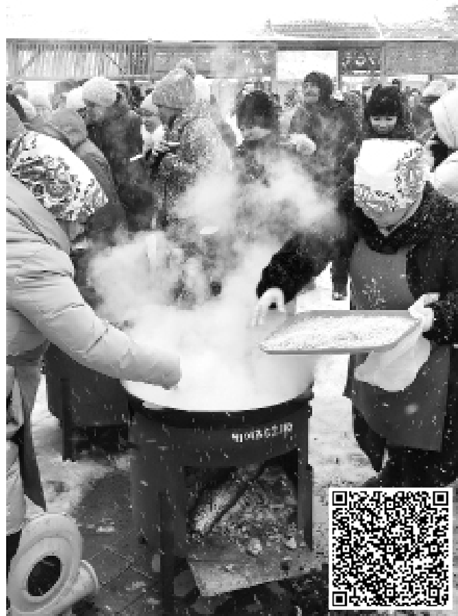
Варится татарская лапша

По-сибирски снежно, радостно, весело, вкусно и гостеприимно отметили тоболяки и гости нашего города День Сибири.