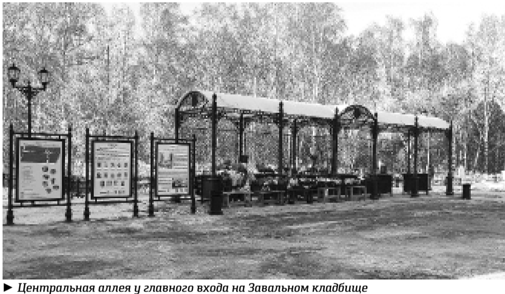
► Центральная аллея у главного входа на Завальное кладбище

«Завальное» связано с месторасположением кладбища за прежней северной границей города – земляным валом, сооружённым в 1688 году. Действует кладбище с 1772 года. К 1773 году все погосты при церквях были закрыты, и количество захоронений на новом кладбище увеличилось. В 1774 году состоялось освящение деревянной церкви во имя Семи отроков Эфесских, выстроенной «на первый случай». А уже к 1776 году была построена и каменная кладбищенская церковь, которая с тех пор никогда не закрывала свои двери перед прихожанами, даже в годы советской власти здесь проходили богослужения. В 1810 к храму пристроили колокольню. В этот период времени места на кладбище стали платными. Бедноту хоронили бесплатно, но с разрешения городской думы.