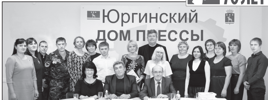
Участники круглого стола «Призыва»

– В специализированных классах по подготовке к службе в армии, созданных практически в каждом селе, проводятся теоретические занятия и практические по физической подготовке. Полевые выходы, районные соревнования собирают ребят вместе. Юргинские курсанты достойно представляют район на областных соревнованиях и военных сборах. Слушатели специализированных классов отдадут дань солдатам