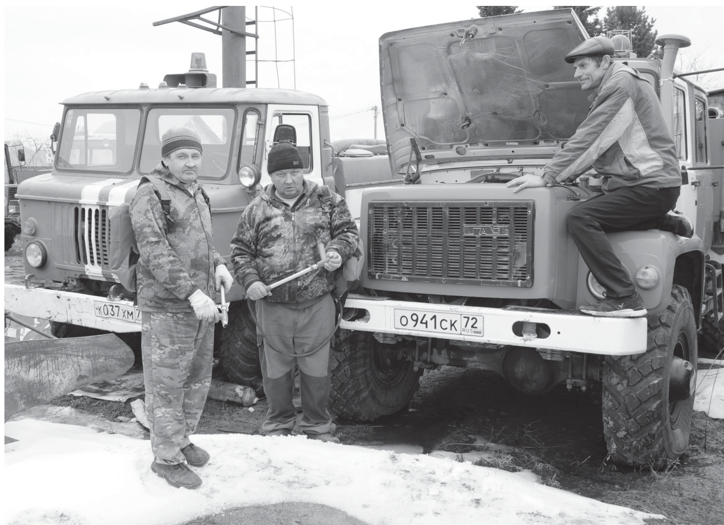
Наступление пожароопасного сезона в районе готовы встретить «во всеоружии»