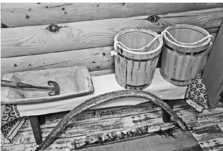
➤ На выставке в музее