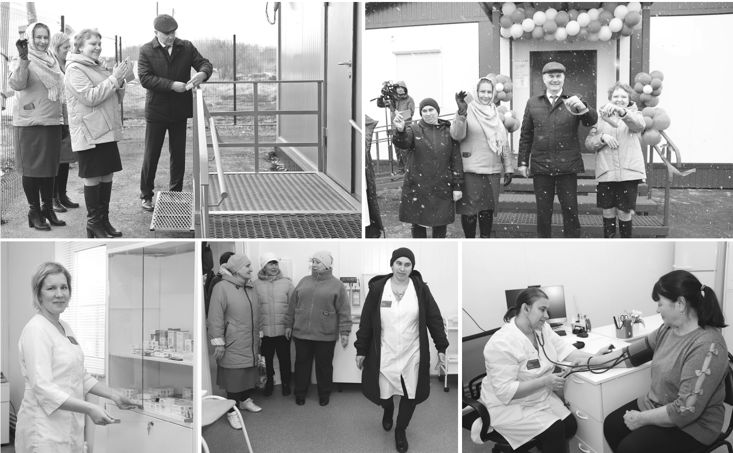
Новые ФАПы – стимул для медработников продолжать трудиться на селе, а для жителей – уверенность, что их потребности в медицинском обслуживании будут удовлетворены

Фельдшерско-акушерские пункты открыли в деревне Черемшанке и селе Голышманово