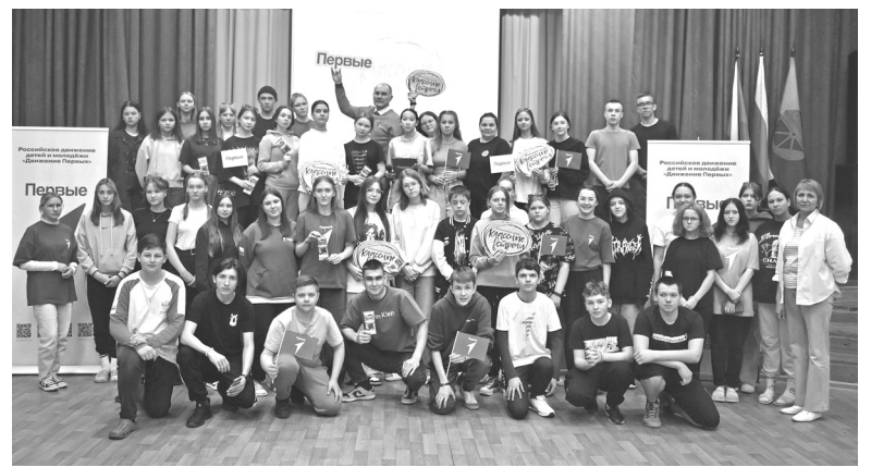
На три дня на «Коммунарских сборах Первых» объединилась молодёжь пяти муниципалитетов Тюменской области