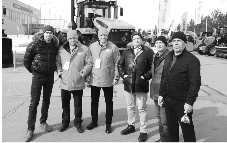
Руководители и специалисты сельхозпредприятий и управления АПК нашего округа – активные участники семинаров и выставок

– Здесь побывали представители большей части сельхозпредприятий нашего муниципалитета – ООО «Юг-Агро», Агрохолдинг «Голышмановский», ООО СП «Голышмановское», ООО «Тюменские молочные фермы», а также мелких хозяйств. Обменивались мнениями, общались, знакомились с новшествами в аграрном секторе и представленной сельхозтехникой, участвовали в тест-драйвах. Руководители агропредприятий заинтересовались пред-